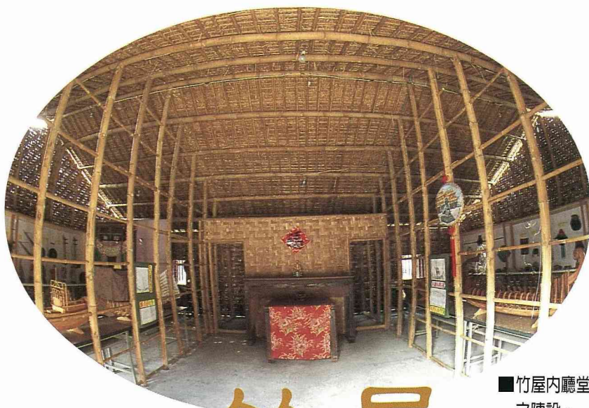
■竹屋內廳堂之陳設。