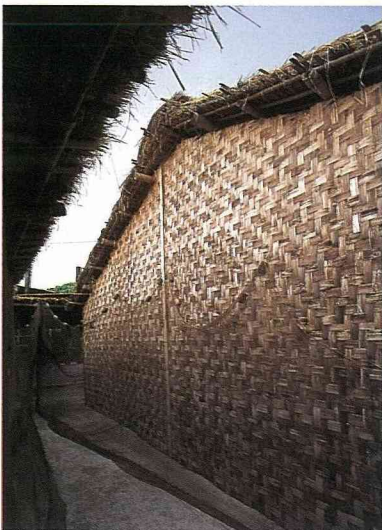
■外牆以竹片編篾而成。

建屋材料，主要是竹性堅韌，又是很容易得到的材料，物美價廉，所以，在廣大的農村普遍利用竹材建蓋房子。