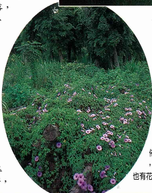
■「阿粉姐」給老樹佈置的家，有青草也有花。

共投入2,000多萬元資金，從事老樹遷移保育工作，雖然截根、挖掘、載運的工程，相當艱辛，又無利可圖，但目睹一棵棵老樹因為她及時搶救，得以免遭被砍伐命運，且在移植後再現生機，就感到無限欣慰。