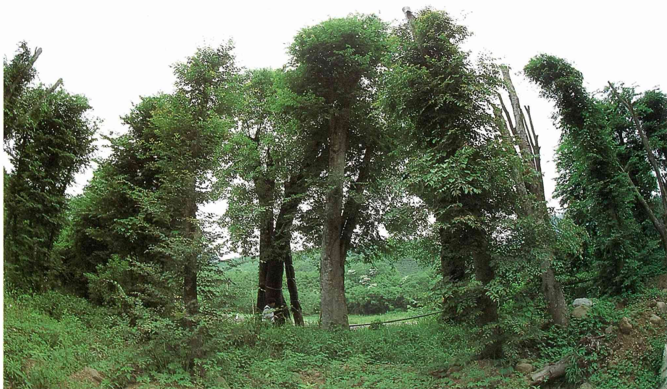
■移植後的老樹再現生機。