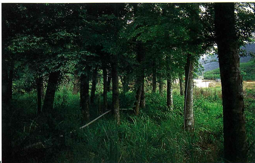
■老樹的家，蕪鬱如森林。