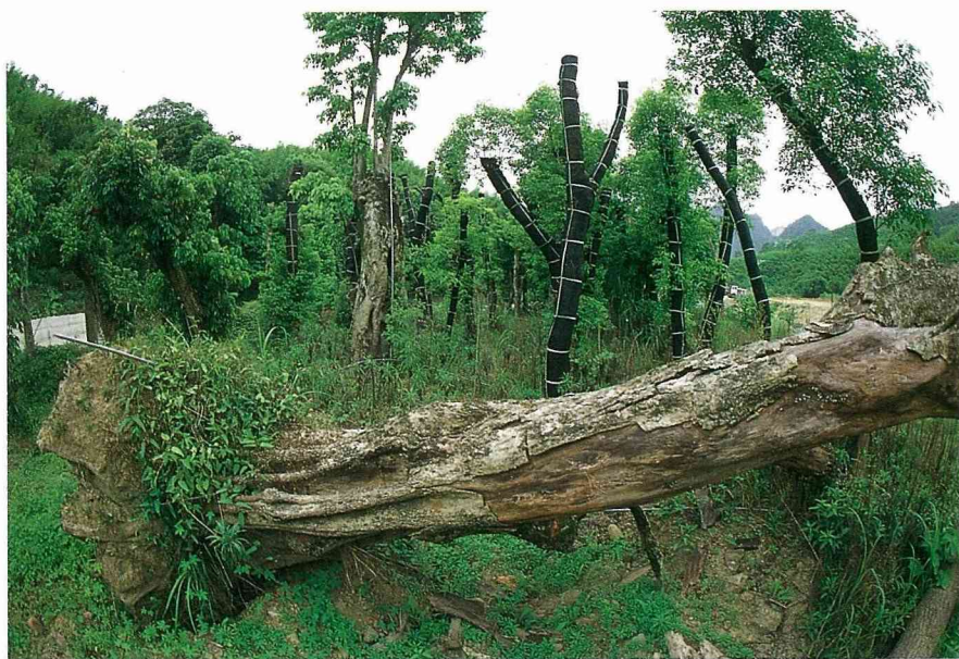
■有的老樹移植失敗，「屍」橫倒地。