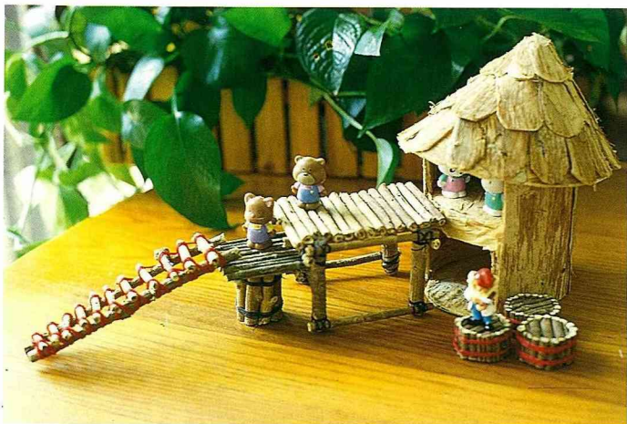
■ 完成的遊戲平台和樹幹屋，雖然是業餘的手法，仍有專業的水準。