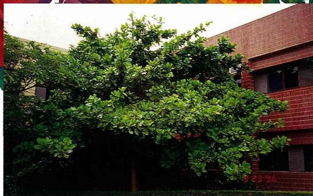
■欖仁的樹型優美，葉色富於變化，是美麗的庭園樹木。

有效，如果說綠葉有效的話，我想欖仁樹早就給人糟蹋光了，這位前輩真是欖仁樹的救命恩人，功德無量。