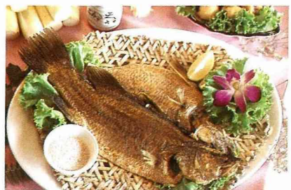
■紹興宴：醉紅蟳與燻魚。

目前，埔里酒廠正積極推動一項「紹興酒故鄉——埔里·品味之旅」的知性文化活動，行程非常豐富，將埔里酒廠、酒文物館、紹興酒泉、酒甕公園花道、黃家古厝、廣興紙寮、眉溪花卉公園、漆文物館、牛耳藝術公園、木生昆蟲館、赤崁頂休閒農場、大坪頂百香果園、金都餐廳「紹興宴」等旅遊據點連線，是國內旅遊「一級棒」的新興旅遊行程。 鄉