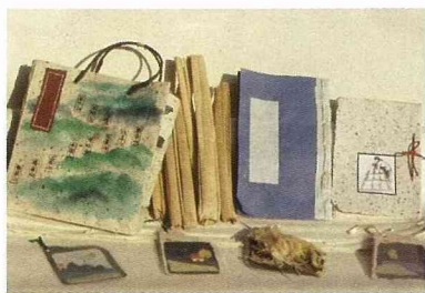
茭白筍殼製造的手工紙產品。