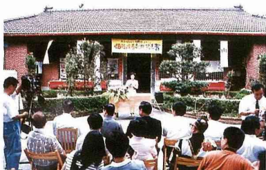
■文化中心在廣興紙寮舉辦「茭白筍殼紙發表會」。