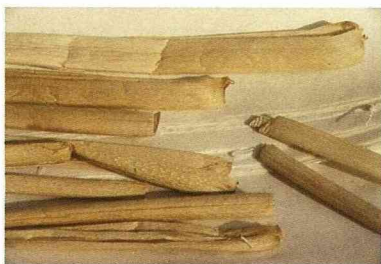
未經漂白，泛著金黃色澤的埔里紙，是符合環保要求的文化產品。