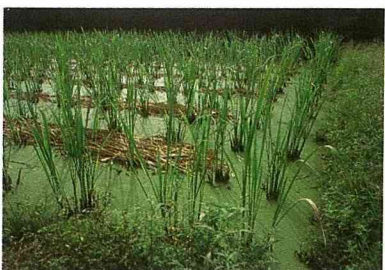
■筍殼棄置田間，會造成排水阻塞。