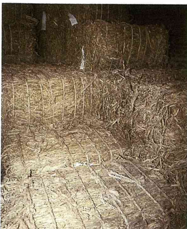
■國外進口的紙漿材料，難以表現本土特色。