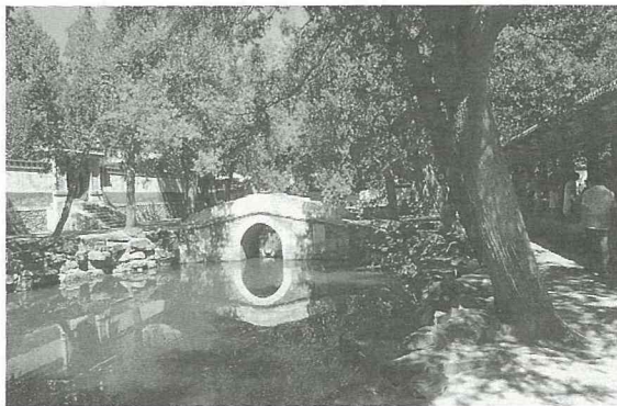
■古都北京到處是茂盛的森林、小橋、流水，舉目所見，皆可入畫。