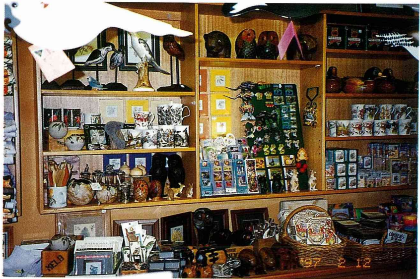
■城裡的藝品店裡陳列著各式各樣和動植物有關的製品，木刻牛、羊、豬、鴨、袋鼠，和印有花草的馬克杯等，真是琳瑯滿目。

在吉斯本，海倫家附近的農莊，進園每人買一袋碎土司，餵園內所有的動物，包括袋鼠、鹿、羊、食火雞、鴨子、水鳥、孔雀、駝鳥…等，溫馴的動物像羊、鴨子、鵝等並未被圈養，可以自由行動，人走到那就跟到那，眼神裡無限的渴望要人餵它。