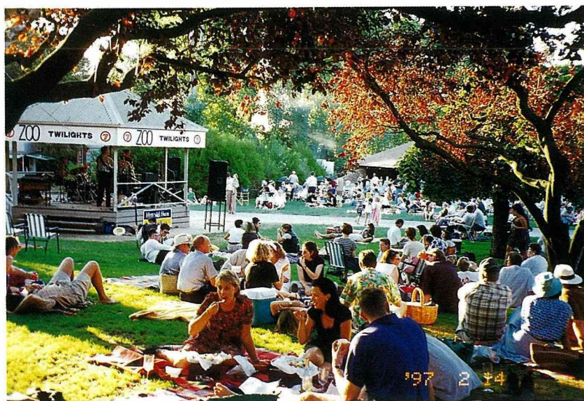
■墨爾本市立動物園在2月14日情人節舉辦野宴，因為是在動物園內舉行，就戲稱「ZOO·B·Q」了。

我等好整以暇，更上一層樓，墨爾本的高樓大廈浮現在樹頂之上，澳洲的樹多以花色見長，像瓶子刷屬的，有白有紅，