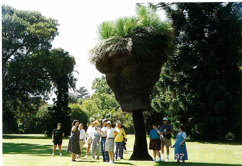
■這棵看來像個草屋的樹，名字叫做「草樹」(grass tree)。

天熱，買一頂帽子戴，上面繡著「墨爾本市」的英文字樣，吾子笑說，在澳洲戴戴就算了，回到台北千萬不要戴，否則人人看到了都要說你「沒有本事」。