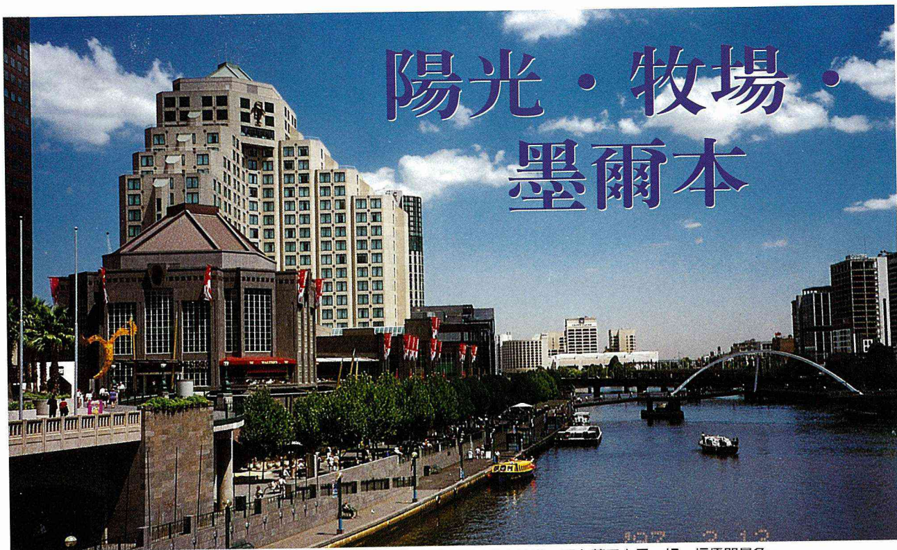
■亞拉河流經墨爾本中心地帶，水質清澈，河上有船航行，岸邊則有椅子供人歇息，配上藍天白雲，好一幅優閒景象。