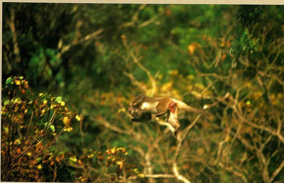
■手脚灵活的台湾獼猴，在樹林中自由的飛來躍去。(福山植物園)