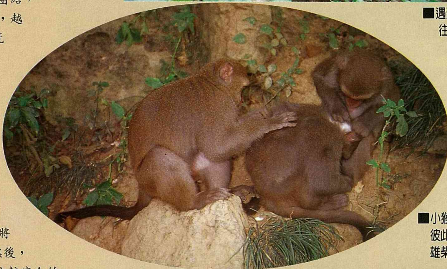
■小猴兒藉理毛來增進彼此之間的感情。(高雄柴山)