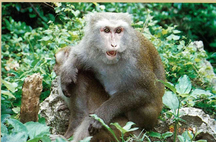
■遇到不高興的事時，往往會滿面怒容、威喝一番。(高雄柴山)

觀察自然的樂趣，在體會生命的偉大與神奇，從猴子的種種行爲，我們可以發現，牠們和人是多麼的相像，本持著對於生命的尊重，任何人不但沒有權力破壞世界，而且，更應該善加珍惜，畢竟，同為地球的一份子，其他生物如果消失了，跟著滅亡的，將有可能就是你我。 圖