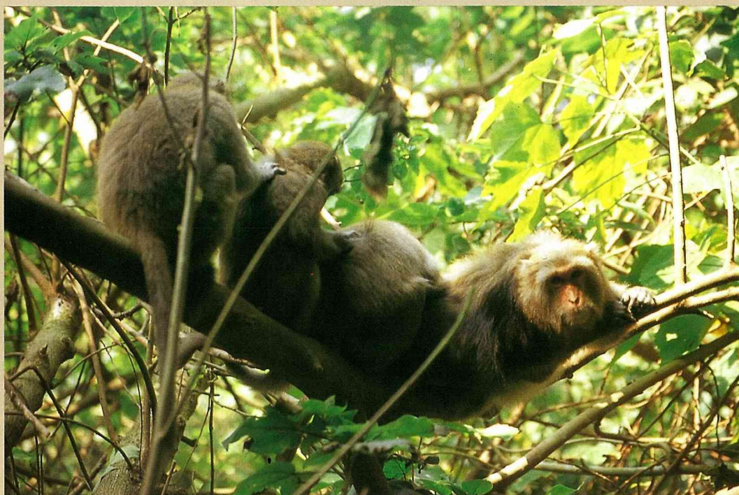
■ 找個舒適的樹幹，大家一起來理毛。(高雄柴山)

實為主食。猴群內的社會階層相當的複雜，其中之一是猴王的制度。一個猴群當中通常只有一隻成年公猴，那就是猴王，而當小公猴長大之後，會被追離群自行生活，建立自己的王國；猴群裡的母猴還分階級，位階越高的，權力就越大，生活也就越享受，例如：猴兒最愛的理毛，就有人代勞，而且，也可以有較多較好的食物可以吃，其中，