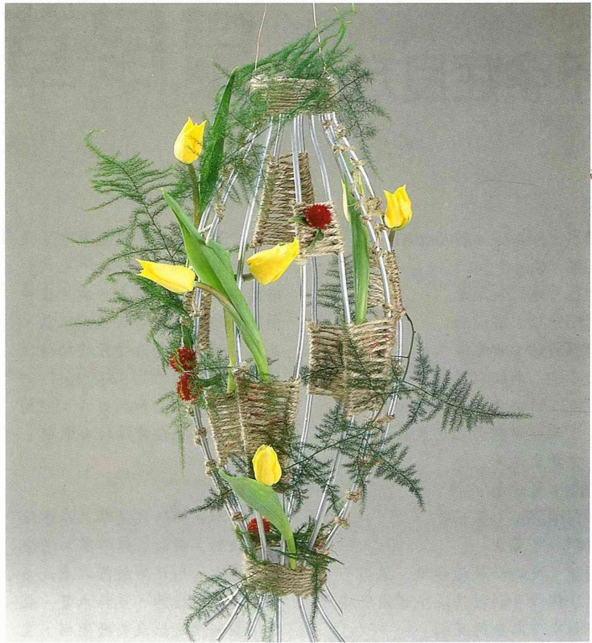
■用鋁條和麻繩自己製作的吊飾，小水管隱藏在麻繩背面，即可用以插花。 (設計 / 林靜文)

在花卉運輸包裝上愈趨講究的時代，也曾經有位德國花藝設計師認為台灣早先用的草蓆、報紙包花運輸的方式很「環保」。東西方、古今交流，老祖宗有很多地方還是相當聰明的呢！