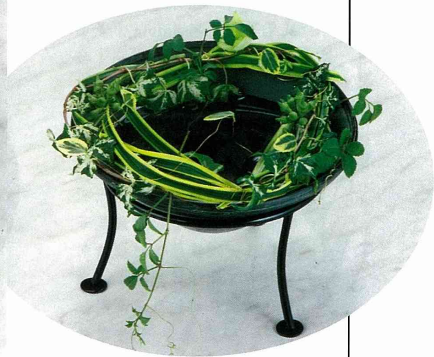
■葉材、藤蔓用鐵絲或銅線輕輕固定環狀，架在花器之上，再將花朵插入杯中，也是一個可以省卻海棉的插花方式。(設計 / 唐淑貞)