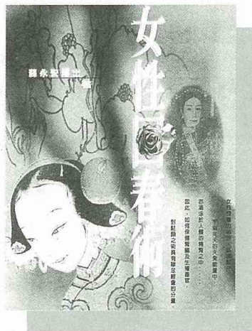
女性回春術 售價 200 元