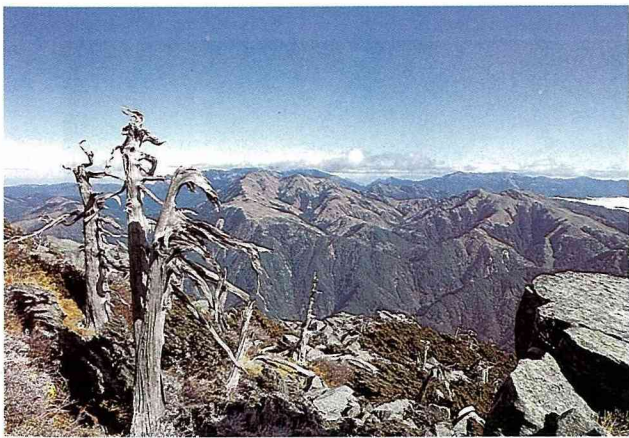
■ 向陽山山頂的枯木，在冬天的晴空下顯的蒼勁有力。