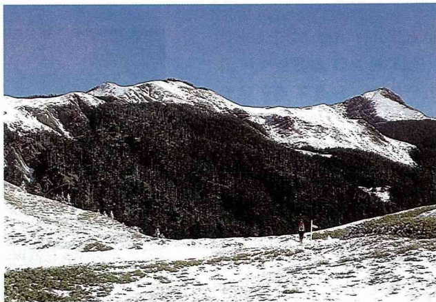
■ 高山上的雪景。在皚皚白雪下都是高度及膝的玉山箭竹。