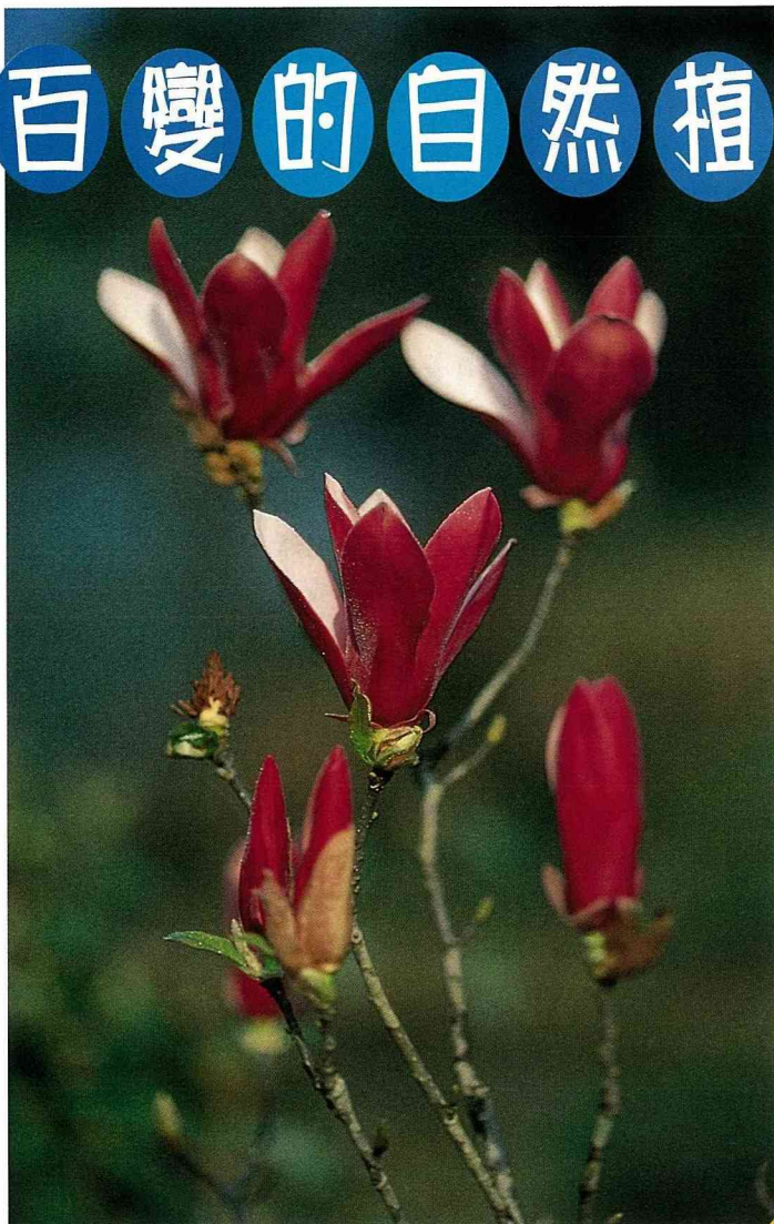
■木蘭是一種古老的植物，不過她鮮紅的花朵卻不遜於其他新生的植物。

春天萬物甦醒，許多植物都換上了新裝，有些抽著新芽，有些則含苞待放。似乎是這略帶寒意的春風輕叩著大地，讓花朵一