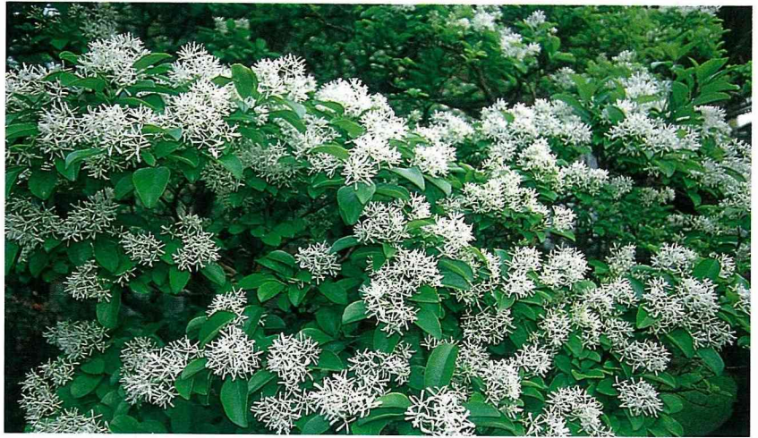
■ 流疏為木犀科植物，樹上的白花，像極了覆蓋著一層白雪，花帶微香。