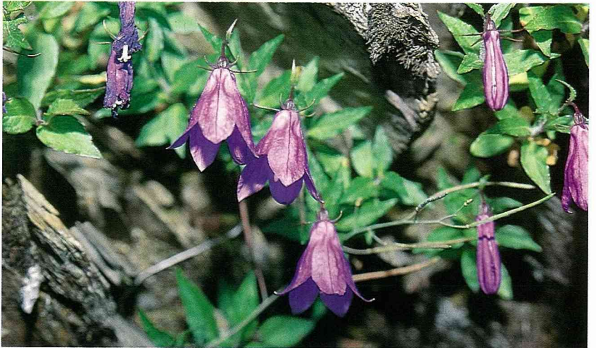
■ 高山沙參為桔梗科植物，生長於高山上的碎石坡，鐘型的花朵，鮮艷的色彩，十分地吸引人。