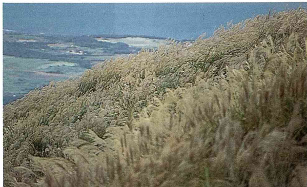
■ 大屯山上的芒花，宛如無垠的大海，乘著風，搖曳生姿。