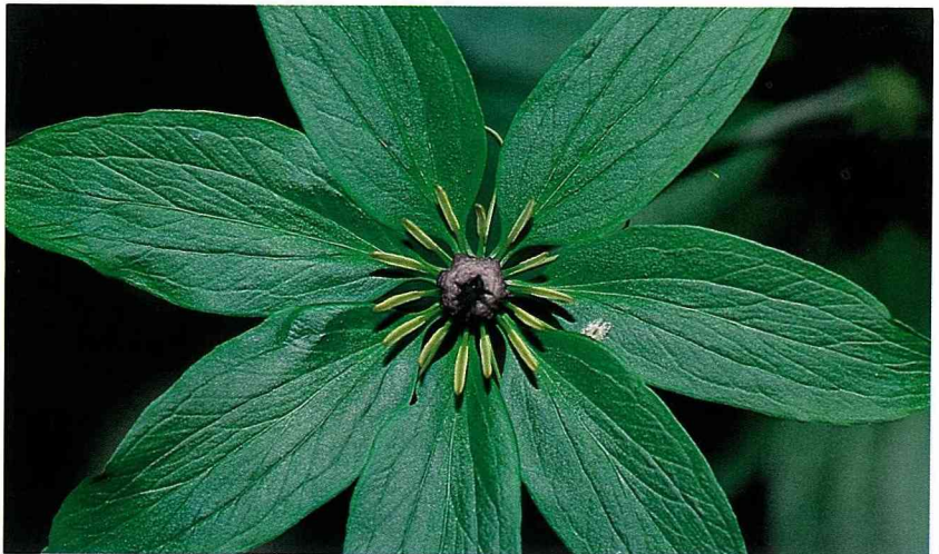
■ 七葉一枝花為百合科植物，花莖由頂端抽出，形狀奇特。在中藥裡被用來解毒。