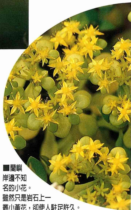
■蘭嶼岸邊不知名的小花。雖然只是岩石上一叢小黃花，卻使人駐足許久。

夏天一到，讓人想到的不外乎是那蒼綠的大樹。乘涼其下，一陣陣沁涼直上心頭。而那五彩的精靈是否停止了綻放？答案是否定的，她們