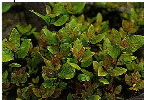
■月桂樹的枝葉芳香撲鼻，被視為有靈氣的樹木而受到讚賞。

學名： Laurus nobilis L. 英名：Baytree, Sweet Bay, Laurel, Victor's Laurel, Poet's Laurel, Grecian Laurel 別名：榮冠樹、月桂、祝捷樹 植物分類：樟科 園藝分類：常綠性灌木或小喬木 原產地：南歐地中海沿岸 花色：淡黃色 花期：春至夏季 用途：食用、藥用、切花、盆栽和庭園露地栽培