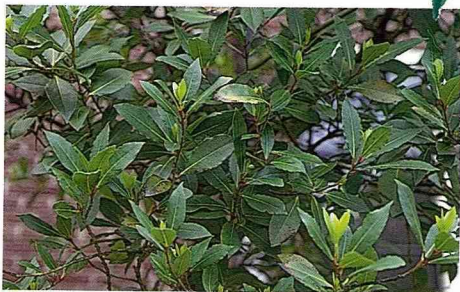
■歐洲人常用月桂葉作為調味料和餐點裝飾。

對於皮膚方面，是頭髮和頭皮的良好補品，可刺激毛髮生長並去除頭皮屑；據說也能打散瘀血、消炎以及促進傷口結疤並縮小結疤範圍。