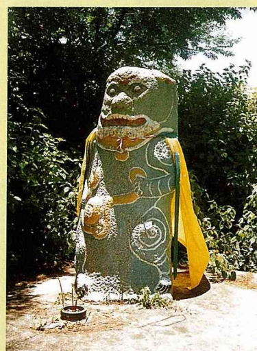
■ 風獅爺的披風愈多，表示神力愈高。