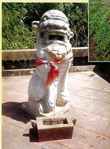
■北山村風獅爺，母獅，高116公分。

爺，常是立於屋脊上，以陶土燒製，高約21公分。屋頂風獅爺又稱「黃飛虎將軍」、「蚩尤將軍」，造型為一威猛武士，頭戴盔帽，身穿甲冑，身軀直挺，左手打直朝前，右手擺胸前呈拉弓按矢，跨騎獅子猛獸，而獅子兩顆大而圓的眼睛怒視，氣勢昂揚威武，民間讓武士騎在最兇猛的獅子上，