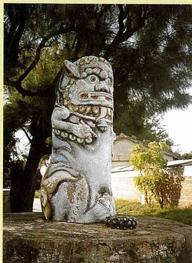
■ 西門村風獅爺，公獅，高144公分。