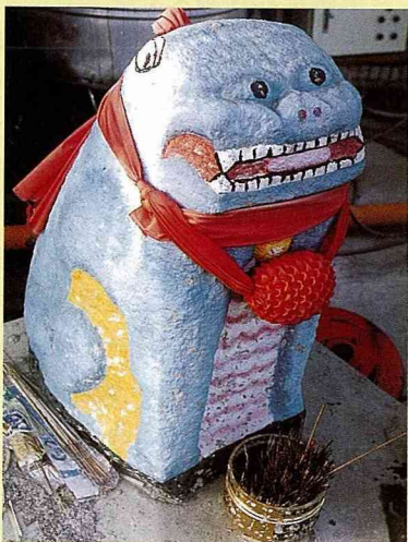
■ 夏興村風獅爺，蹲坐，母獅，高70公分。