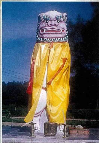
■金門風獅爺，辟邪鎮風煞。

揭開神秘的戰地面紗，開放觀光之後的金門， 成為台灣的一個新興旅遊勝地，除了 參觀金門的浮面外象，要真正認識金門，恐怕得帶著 一顆尋訪土地真誠的心，走入沉靜的金門鄉間小路， 看看那些屹立風口、不畏歲月風霜的風獅爺， 看看金門人與風獅爺融為一體 ---- 金門，才有她自己的味道。