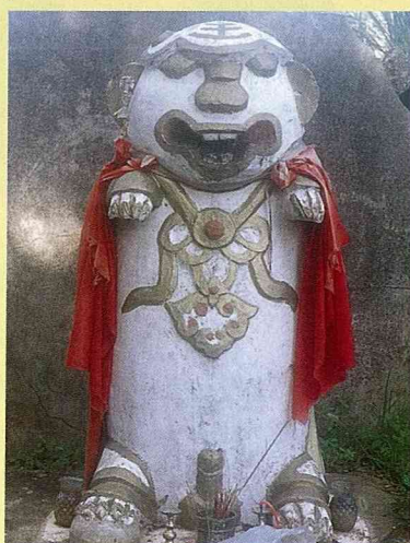
■ 湖下村風獅爺，公獅，磚泥材，高140公分。