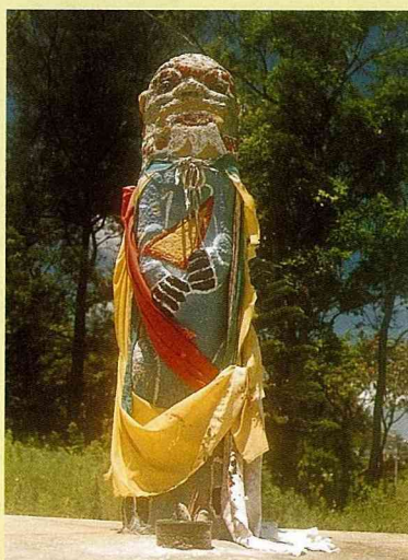
■ 陽宅村風獅爺，母獅，石材，高120公分。