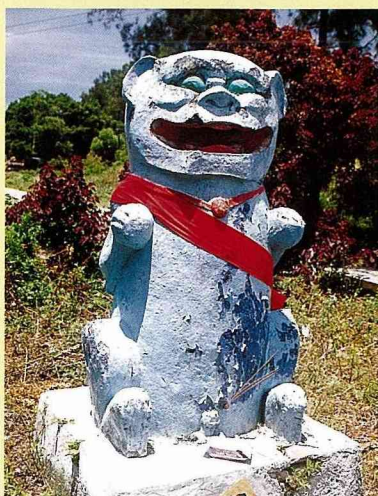
■夏墅村風獅爺，高140公分，公獅。