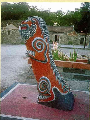
■ 湖前村風獅爺，母獅，鎮陳氏虎穴祖墳。