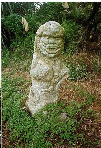
■渾厚古樸的田墩村風獅爺，母獅。