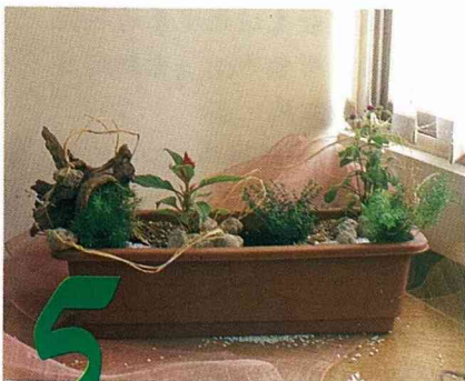
圖五 花槽也是典型的花盆

之一，這種55到60公分的長槽，是本省最普遍的花槽尺寸。花槽基本上是線形的感覺，優點是節省空間，所以即使是窗台窄窄的一條，這樣零碎空間，一樣能充份的利用。