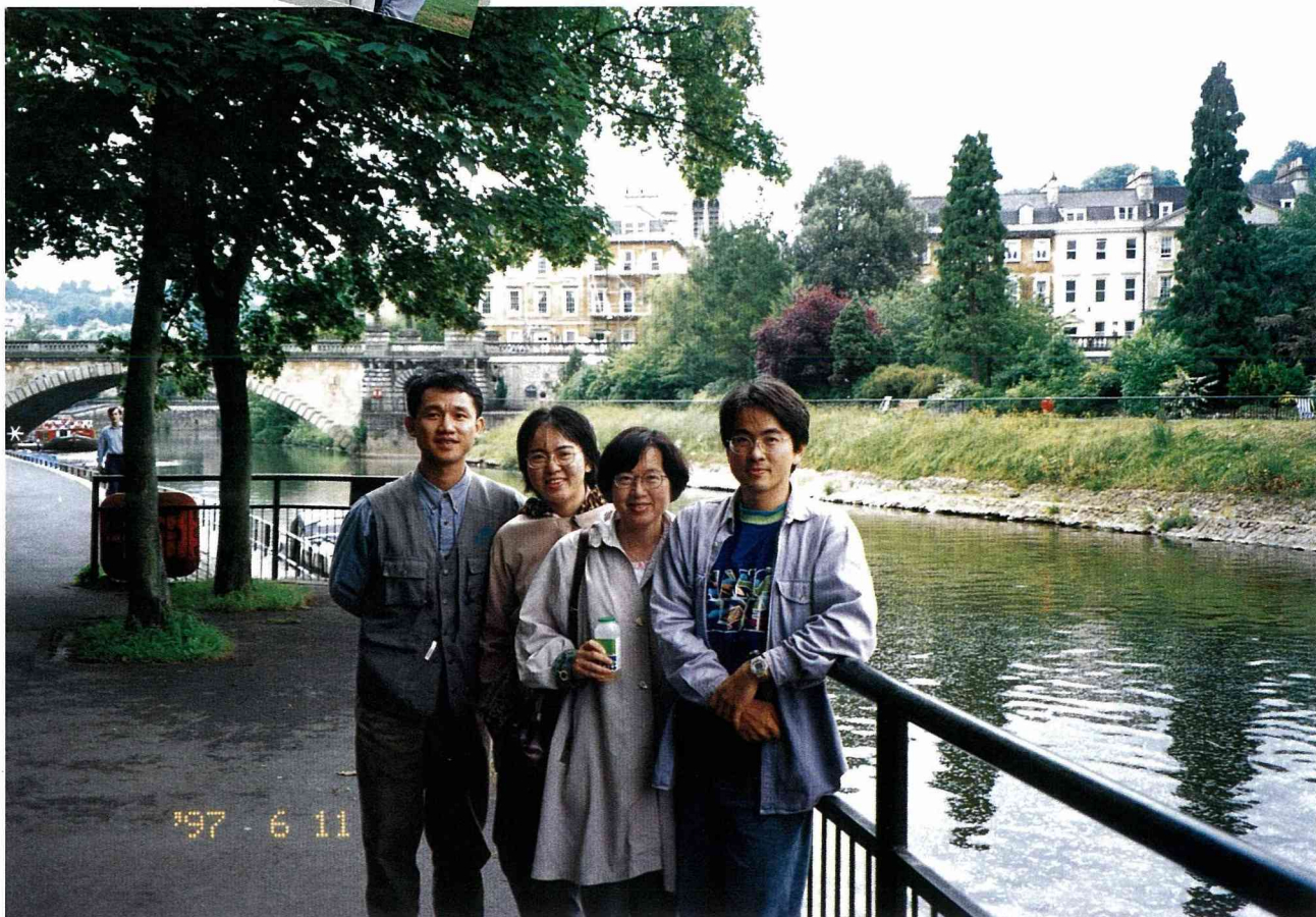
■我們在這條 River Avon 旁吃午餐，並享受午后的陽光。