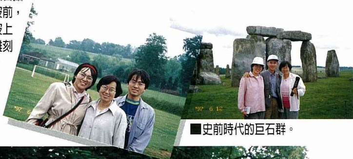
■史前時代的巨石群。