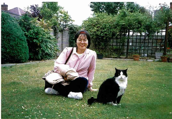
■作者和民宿女主人的貓合影留念。

棒！這裡真得不輸五星級飯店呢！」母親由衷讚美。英式早餐搭配漂亮潔淨的器皿，不僅大家心情愉快，更覺食物美味可口。