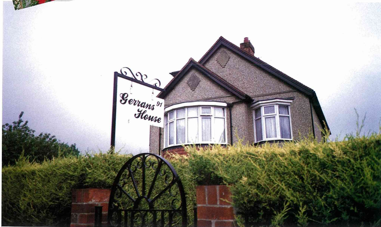
Gerrans House 是典型的英國民宿，完全讓你有回家的感覺。