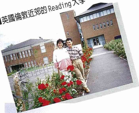
英國倫敦近郊的 Reading 大學。