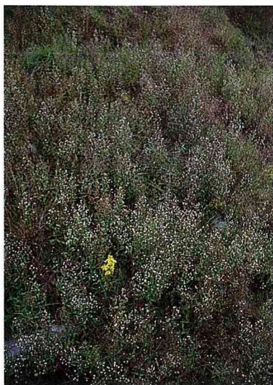
■野地裡綻放的小花，而在叢花中矗立一株黃色的花顯得格外的引人注目。

哇 ！時間過得可真快，時序才從春起，轉瞬間已入初冬。人們驚覺時日過得匆匆，不過這大自然的舞台卻悄悄地隨著四季的腳步，準時地更換著佈景。台灣是一個美麗的寶島，擁有多變的景觀，即使在同一個地點，往往在不同的時間，就會產生截然不同的景色。