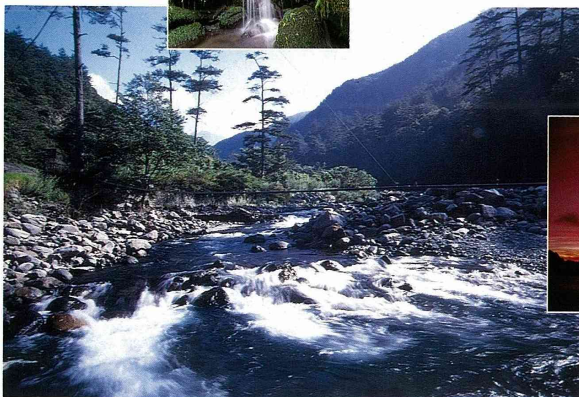
■急促冰涼的溪水，激起白花花的水波，秋意正濃。