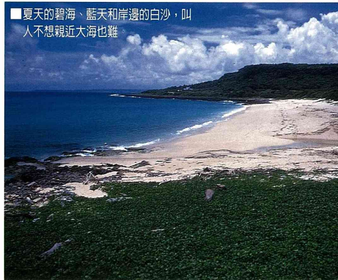
■夏天的碧海、藍天和岸邊的白沙，叫人不想親近大海也難

不過台灣有許多沙灘並不太安全，往往看似平坦的沙灘，在不到十幾公尺的距離內，就有極大的落差，所以仍需謹慎地選擇適當的地點才是。而沙岸邊常見的馬鞍藤，更襯托出海天一色的美景。岩岸除了崢嶸的奇岩怪石外，珊瑚礁沿岸的生物相更是多彩多姿，來趟海岸生態之旅也不遜色。