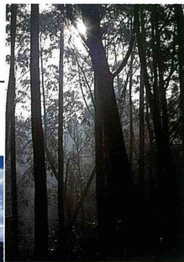
■參天的大樹和森林獨有的芬多精，讓你輕鬆的遠離夏日的驕陽。

而如果你(妳)嫌海邊太熱，那林中徐徐吹來的芬多精，再適合不過了。蒼鬱的大樹，陪著妳走過林間小路，陽光穿過枝梢，透過空氣中塵埃的反射，光影交錯縱橫，美不勝收。眼見為憑，文字豈能形容其萬一，等來年也安排一次林間快樂遊吧！我想妳一定會有意想不到的驚奇的。