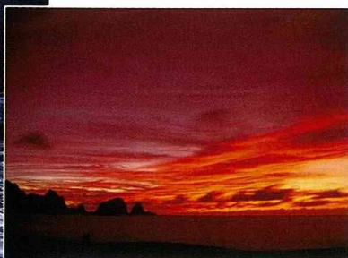
■絢爛的彩霞，為許多情侶譜下美麗的回憶。

夏天颱風季剛過，山谷中還有盈盈滿滿的水，往下游直竄。台灣的溪流短且急促，尤其是在上游地區。如果你曾經到過山間溪谷，你可能會被這台灣上游景色所吸引。水是如此清澈，被溪中石頭激起的水花是如此的雪