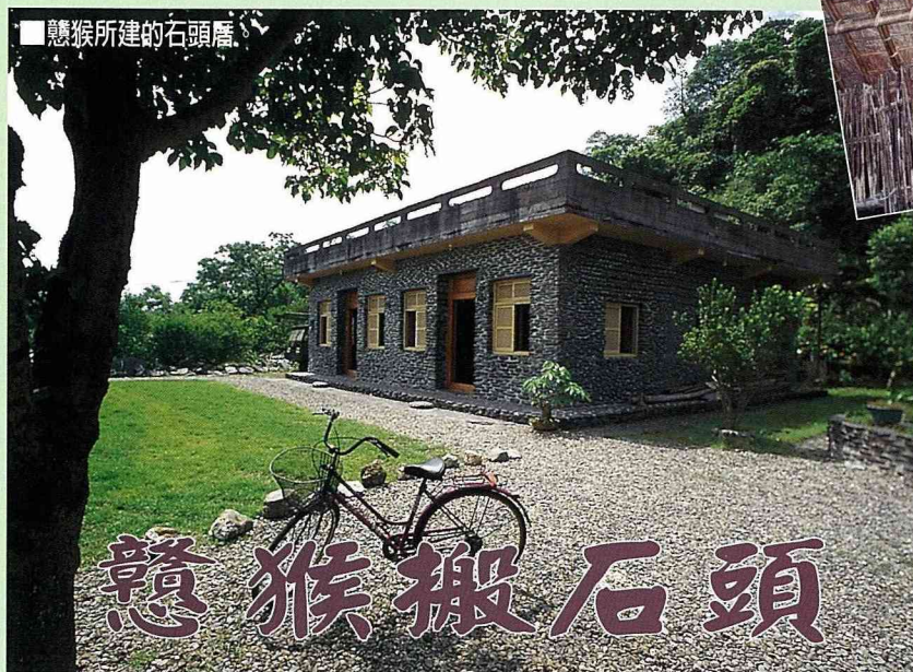
■ 慧猴所建的石頭厝。