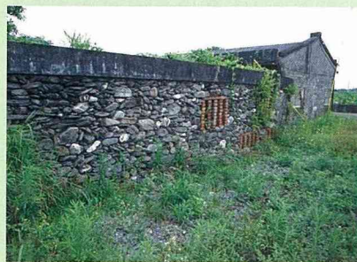
■ 慧猴把石頭搬回家，築牆建屋。

慧猴把石頭搬到那裡去了呢？原來村民把石頭搬回家，把臨時搭建的茅仔厝拆掉重蓋，改為砌石壁的茅仔厝，更為堅固。用不完的石頭，便在稻埕外圍砌築一道石頭矮牆做為分界，因為買不起「紅毛土」（水泥），牆必須砌得矮一點，堆寬一點，又不想讓四處遊蕩的雞鴨鵝豬跨牆而