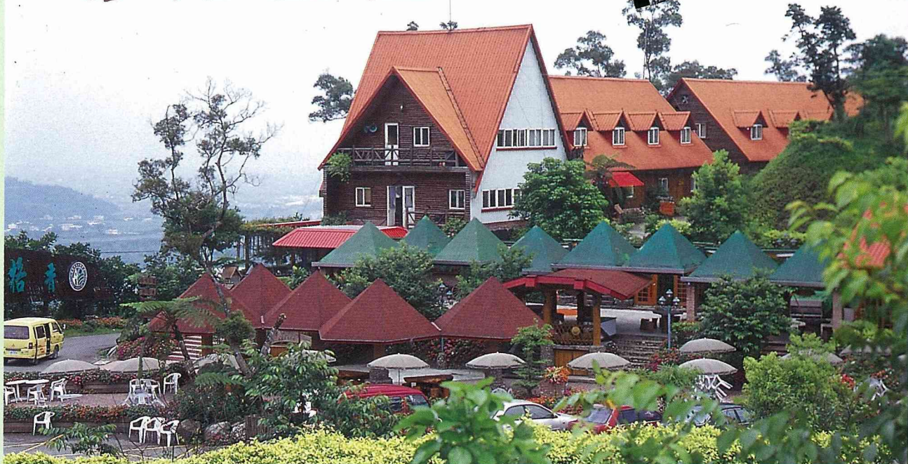
■歐式木屋粧點得美不勝收。