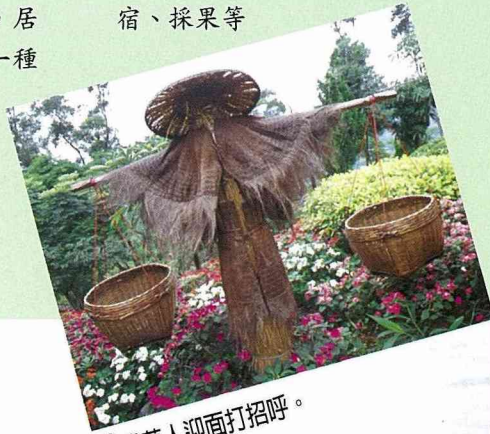
■稻草人迎面打招呼。