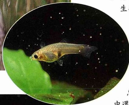
■雌魚的體色較為平淡。