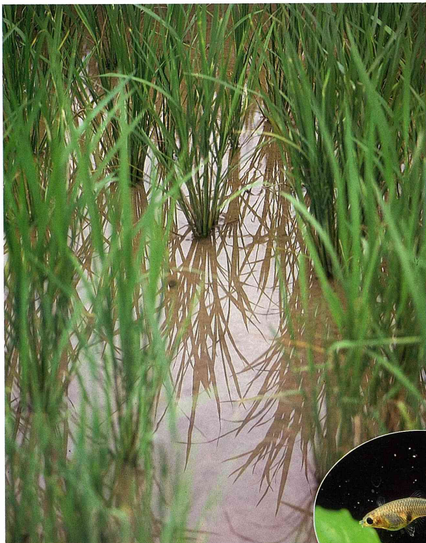
■水田裡最易找到孔雀魚。