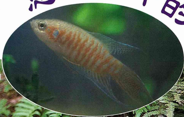
■ 橙藍相間的體色，充分顯現蓋斑鬥魚的美。