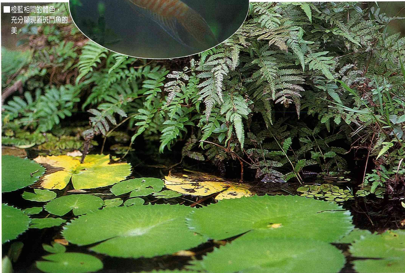
■ 靜止水域的陰影下，是蓋斑鬥魚築巢的好地點。