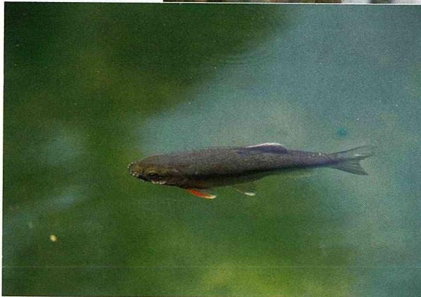
■台灣馬口魚在溪流中尚易見到。