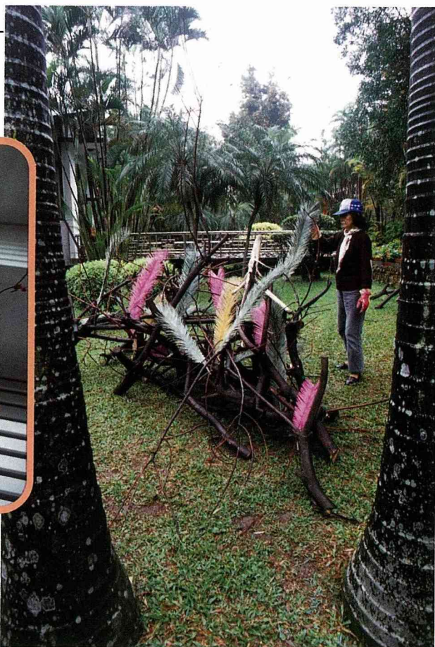
■ 戶外大型作品設計。