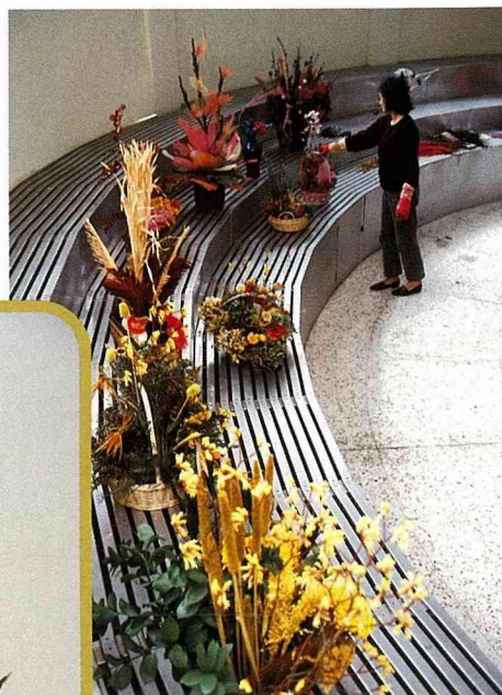
■ 花展的作品漸成雛形。

而自滅。我們也到深山去探幽，把不引人注意的小植物帶回家細心培養，在這方面我們母子曾經花過不少心血。他在山上曾數度遭蜂螫、蛇咬，可以說是冒著生命危險在工作；我在製造乾燥花過程中則常因藥物過敏全身紅腫，影響視力及健康，我曾經有過放棄這些研究工作的念頭，但他從來未有過這樣的想法。