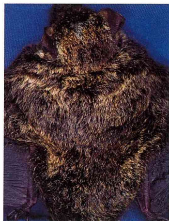
■蝙蝠不是黑黑髒髒的，有些種類的毛色甚至可以用斑斕來形容。

的毛色也相當有特殊。例如渡瀨氏鼠耳蝠，牠們具有金黃色的毛，不過翼膜卻呈現雙色，在國外都稱牠們為黃金蝠。其實蝙蝠不像一般人所想像，都是黑黑髒髒的，有許多種類的毛色甚至可以用斑斕來形容。不過老實說，牠們在黑夜裡看起來實在是一般黑啊！