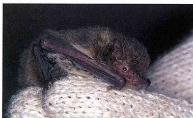
■東亞家蝠是最常見的蝙蝠，常出現在住家附近。

人們常說「一顆老鼠屎，壞了一鍋粥」，不過蝙蝠的排遺似乎有著截然不同的意義。由於大部分的蝙蝠都是群居性的，所以牠們在所居住的地方通常會有厚厚的一層排遺堆在地上，像座小山。有些長期有蝙蝠居住的洞穴，厚度可達數十公分。據說曾有人將蝙蝠的排遺處理過後，當成一味中藥材，不過主治甚麼病