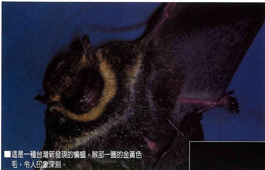
■這是一種台灣新發現的蝙蝠，喉部一圈的金黃色毛，令人印象深刻。