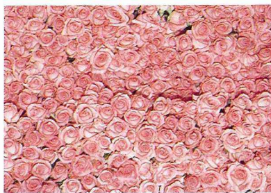
■美麗的粉色玫瑰——黛安娜。

一朵朵千嬌百媚的鮮花，經過三到六個月辛勤的照顧，終於可以收成了，在花農眼裏這可是他們的心血結晶，是一家生計的泉源。小心翼翼的剪下，依花朵大小、花枝長短分類後，五枝、十枝或二十枝細紮成束，然後包裝起來送往市場。然而，鮮花是有生命的，是持續在生長的，要如何保持新鮮，使他們在消費者案上床頭的瓶插壽命盡量延長，是一門很大的學問。