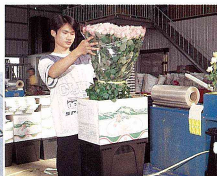
■用儲水容器裝盛玫瑰，提高切花品質，延長瓶插壽命。

有些特別需要水分滋潤的花，在採收後得先插在滲有保鮮劑的水裏，經過數個小時飽吸水分後才能包裝。花兒是活的，不斷的進行呼吸及蒸散作用，也不斷的產生熱能，所以在包裝好後