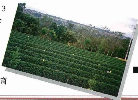
■ 苗栗怡香觀光茶園。