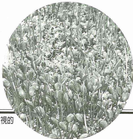
芽菜是越來越受重視的天然食品。