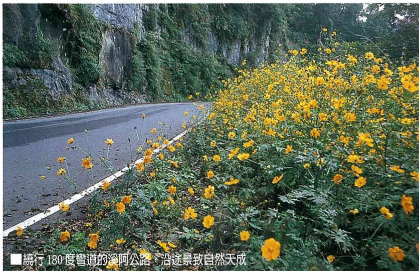
■ 繞行 180 度彎道的溪阿公路，沿途景致自然天成。