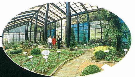
■藥花園具備學術研究與社會教育功能。