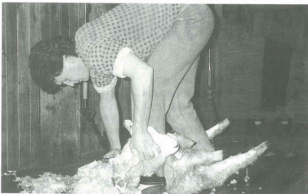
■ 養羊大國紐西蘭，以優美的觀光牧場吸引各國旅遊人潮，剪羊毛是重頭戲之一。

3. 禁止附近有狗的活動：儘管毛海中只摻雜混有一根狗毛，則整袋毛海品質被歸類於下等級，此即所謂諺云：「一粒屎壞一鍋飯」。