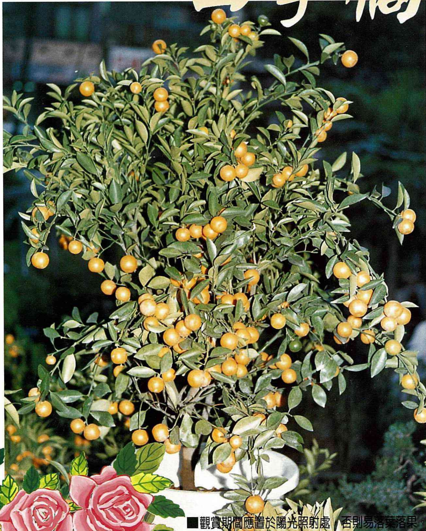
■ 觀賞期間應置於陽光照射處，否則易落葉落果

俗 稱金橘的四季橘，是農曆春節期間最常見到的觀果植物之一，不論是盆栽，或是切花，似乎到處都可以看到它結實纍纍的模樣，因為只要意味著喜氣、吉祥的事或物，都是我們中國年節中所不可或缺的，也因此，代表著大吉大利的四季橘，在農曆春節期間，實在可以算是最具年味的植物了。