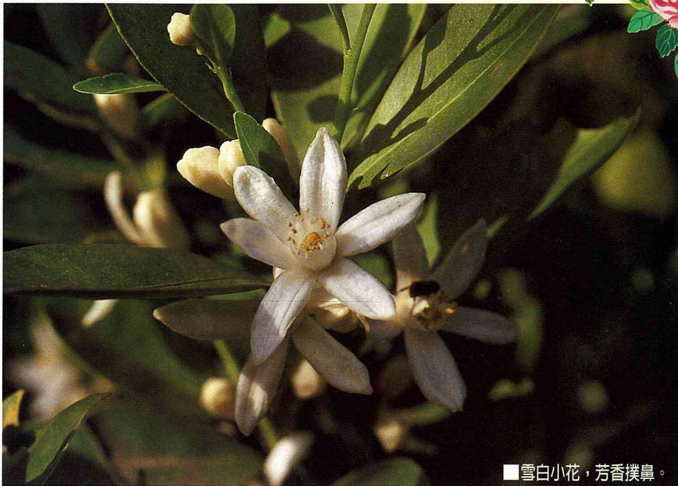
■雪白小花，芳香撲鼻。