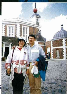
■格林威治天文台是倫敦觀光重要景點。

英吉利海峽，我們在那兒吹海風，撿鵝卵石，海風有點大，我趕緊穿上毛衣，接著我們繼續開車前進，不一會兒便到了更熱鬧的海灘遊憩區Bournemouth了，其中一棟是電玩區，旁邊有許多