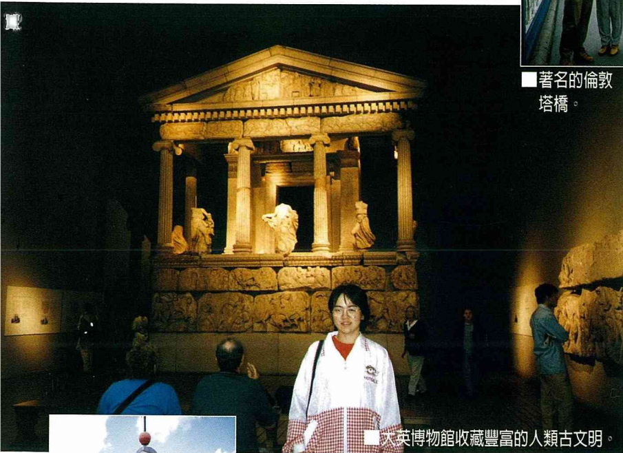
■大英博物館收藏豐富的人類古文明。