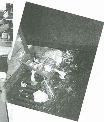
■夜市裡，常見到隨意棄置的垃圾。