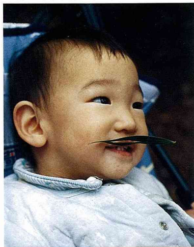
■裝上俏皮可愛的樹葉鬍子，想不笑也難。

有 人用本省的一種原生樹來形容戀愛的過程，「相思、苦棟、合歡」是不是非常有趣貼切。也許您對其中的一種樹都沒有什麼特別的感受，但您從小到大一定參加過很多烤肉活動吧？烤肉時不可或缺的木炭，就是用相思樹悶燒成的，所以說沒看過相思樹，也吃過相思樹炭烤肉。