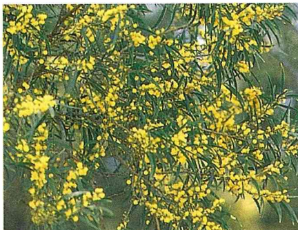
■初夏5-6月間，一樹黃花說相思。