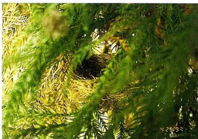
■冠羽畫眉的巢十分隱密，在梅峰地區常築巢於柳杉的枝幹上。