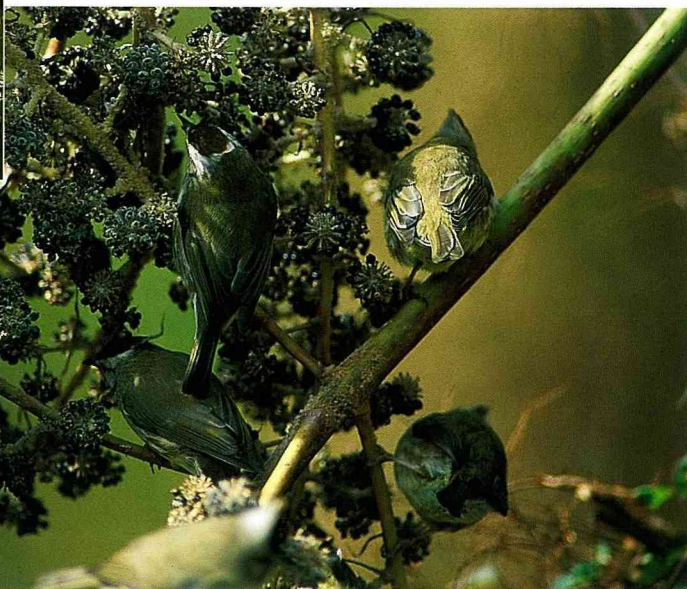
■冠羽畫眉常成群在樹梢上覓食，動作十分敏捷。