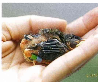
■對捕獲的鳥兒進行測量，許多鳥類身形的特徵就可以得知。