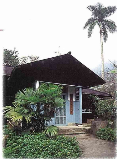
■林試所六龜分所扇平工作站，是六龜分所轄區內的重要研究站。

似麻竹筍，但體型大一號，雖略帶苦味，但尚可接受。餐廳的歐巴桑將其砍下、切條，再下鍋加水煮，使苦澀味減低，然後不論炒肉絲或滷肉，都很可口，或將