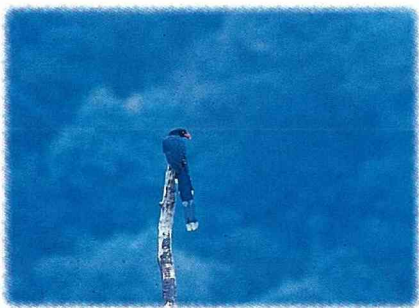
■台灣藍鵲，扇平之寶。

身寶藍，長尾，如身著藍色長禮服的盛裝貴夫人，氣質高雅，悠遊山林。在扇平很容易見到藍鵲芳蹤，筆者前不久就在扇平工作站辦公室附近見到一群3隻，飄然飛過。由名攝影家劉燕明拍攝的記錄片「藍鵲飛過」，就是在扇平花了3年多時間才拍成。