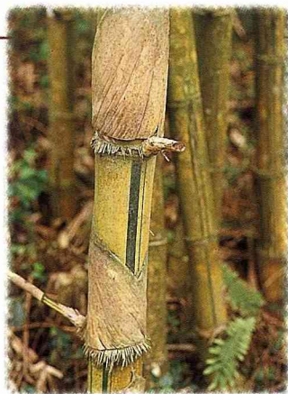
■竹園內的珍奇竹種之一：金絲竹。

夏天漫步扇平，得特別小心足下，不要踩到蛇。扇平蛇之多，是頂有名的，種類包括南蛇、青蛇、錦蛇、大頭蛇、百步蛇、過山刀、雨傘節、臭青公、龜殼花、擬龜殼花、赤尾青竹絲、梭德氏遊蛇、白梅花蛇等。蛇類越毒則越不怕人，可能是有恃無恐吧。筆者每次至扇平出