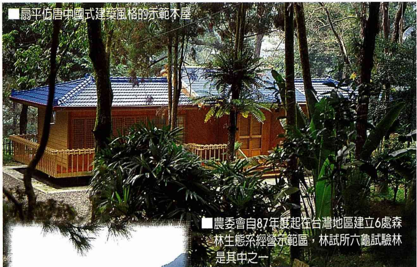
扇平仿唐中國式建築風格的示範木屋