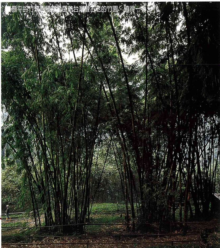
■扇平的竹類原種園為目前台灣最古老的竹園，值得一看。

扇平有兩棟示範木屋，非常醒目。A棟木屋係綜合中國式建築風格，採用該分所轄區25林班之天然紅檜障礙木為主建材，民國79年興建完成。B棟木屋是美式建築風格，以分所人工造林地所生產之台灣杉為內裝，進口北美材為外板，民國82年落成。木材是自然有機物質，具有調節溫