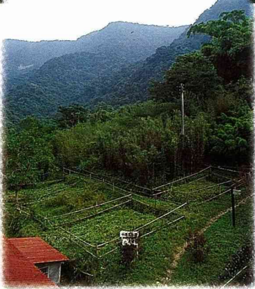
農委會自87年度起在台灣地區建立6處森林生態系經營示範區，林試所六龜試驗林是其中之一

六龜分所前長了數棵高大的麵包樹，夏天結滿了麵包果，筆者初去六龜時，發現六龜人不會吃麵包果，成熟的麵包果落滿地。麵包果成熟後，將外皮削除，不論煮湯或炒都很可口。扇平與旅居扇平的懷才異鄉客，正如這些高大的麵包樹，默默無聞。回顧筆者十餘年前的詩作「麵包樹」，可寫實此等情境：