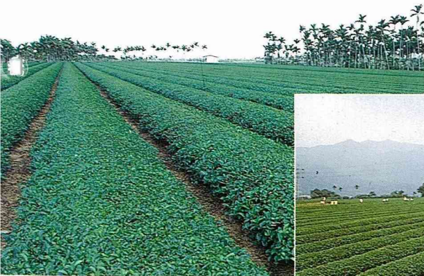
■名間松柏長青茶區。