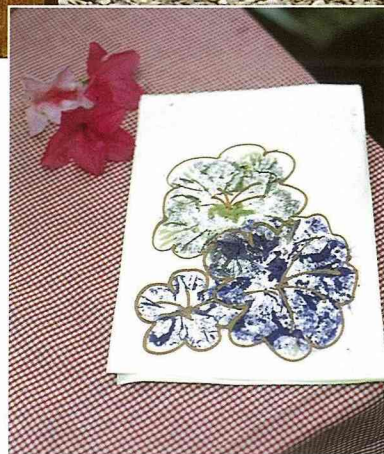
■加工做成敲染花卡。