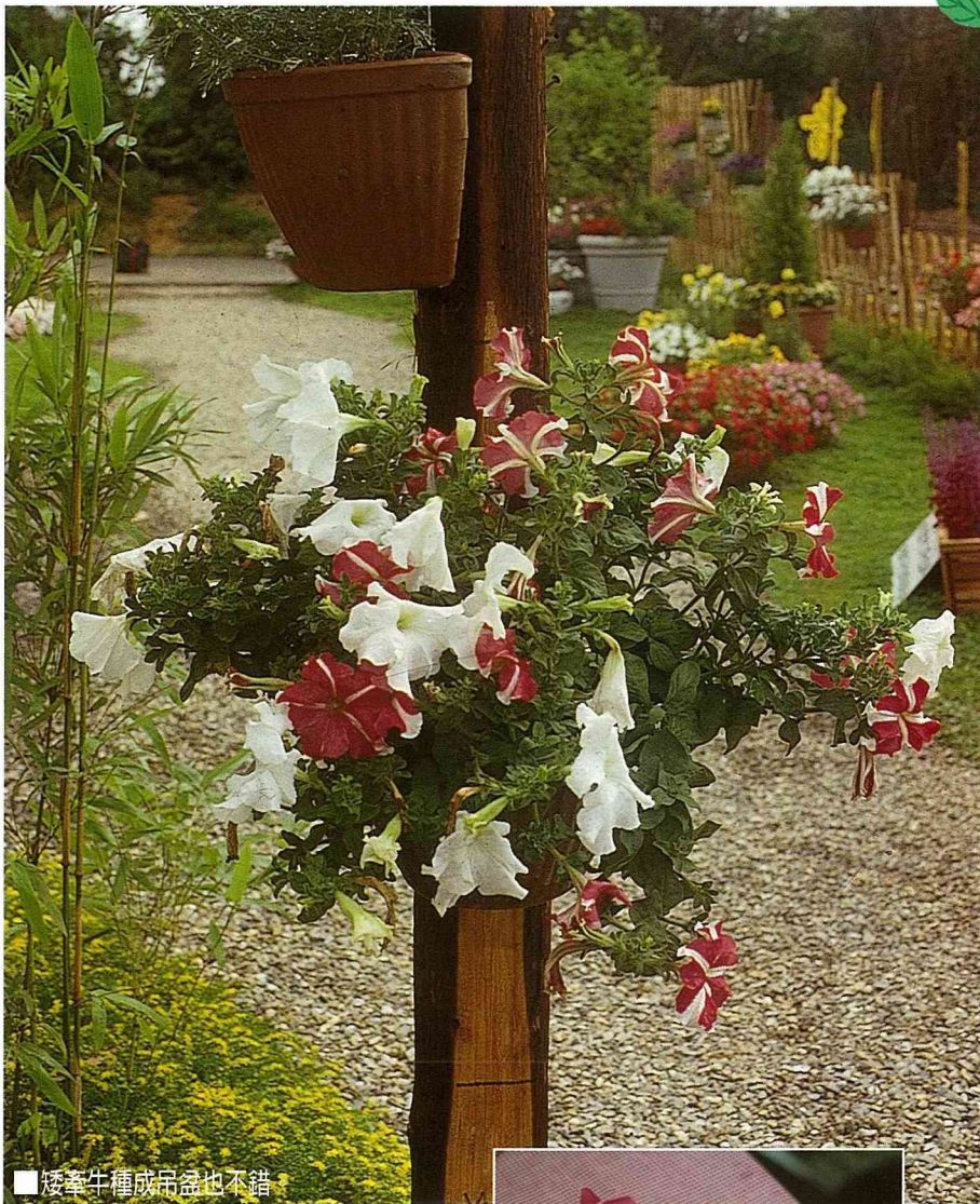
■矮牽牛種成吊盆也不錯

就可以敲出花痕及色素。然後再將圖案設計成卡片，如果圖樣不十分明顯，再用彩筆加以描繪。