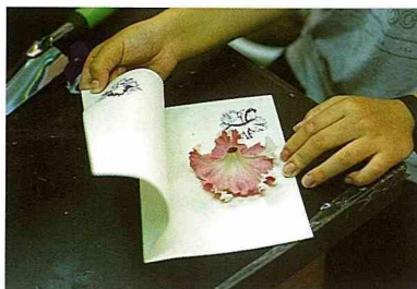
■把花朵採下夾在有吸水性的紙張中。

採下色彩較濃郁的花，除了矮牽牛，鳳仙花、鴨趾草都可以試試，夾在兩張紙中，用棉紙或有點吸水性的紙如粉彩紙，壓平，用鈍木輕輕均勻的敲紙背，