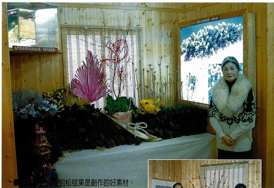
金門的松毬果是創作的好素材。