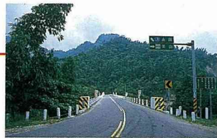
■大埔橋頭青山翠綠。