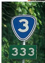
■澧密戰道是台三線省道的一段。

若問起「澧密戰道」，有些人會說沒聽說過，或以為是抗日時期擊退日軍的通道，因為翻遍旅遊指南或交通路線導引，也未見任何描述。其實，「澧密戰道」是省道台三線的一段，由嘉義澧水通達台南密枝，不過，因戰道的起點、終點都無明顯的標示，只有在大埔橋畔的涼亭內，有一塊「澧密戰道紀念碑」，算是澧密道唯一的標示。