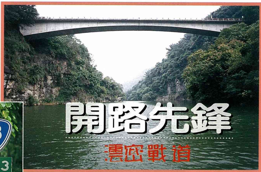
■大埔橋為伸臂式無橋墩之拱橋。