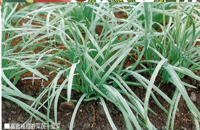
■富含纖維的菜蔬：韭菜。

韭菜富含水份及維他命A、C、鈣、磷、鐵等營養成份。適炒食、煮湯、陽春麵佐菜及包餃子、做韭菜包等。整株洗淨，沸