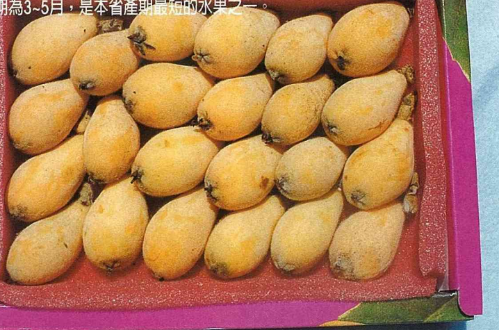
■枇杷產期為3~5月，是本省產期最短的水果之一。

是 薔薇科多年生常綠小喬木植物。葉長橢圓形，有短柄，花頂生於枝梢，灰褐成團，具有特殊的芳香味。果實有長圓形、倒卵形、長或圓倒卵形，外皮橙色或橙黃色，果肉顏色和果皮相似。原產我國華南江蘇、浙江、福建、廣東各地。本省產區多集中在中部海拔500公尺以下的山坡地、台地及平地。栽培面積以台中縣最多，苗栗縣次之，南投縣第三。主要產地有苗栗大湖、卓蘭、台中縣東勢、新社，南投縣魚池、國姓等鄉鎮。本省栽培之經濟品種，多為大粒，果肉橙黃色品質良好者。其中栽培面積最多者為茂木品種，次為田中品種，其他楠、瑞穗及戶越等品種栽培較少。枇杷是本省產期最短的水果之一，產期僅於春季的2月上旬至5月上旬，盛產期在3月中旬至4月下旬，是清明節掃墓祭拜祖先之應節水果。