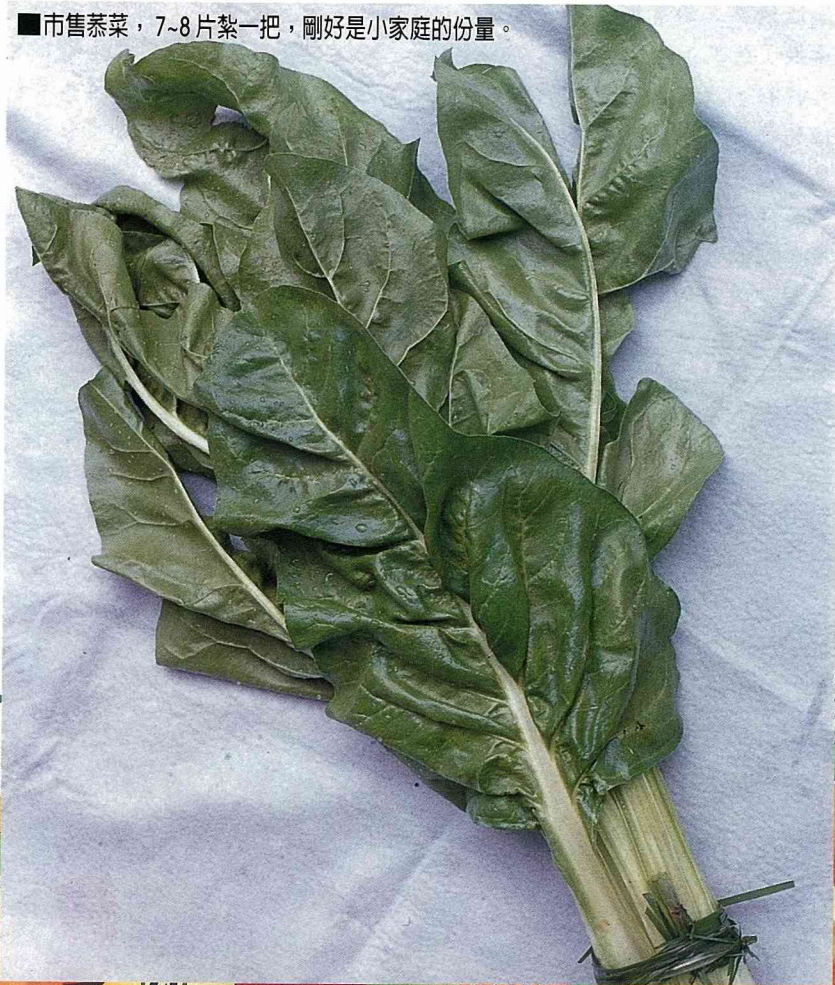
■市售恭菜，7~8片紮一把，剛好是小家庭的份量。

恭菜維他命A含量相當高，其他營養成分有水分、蛋白質、醣質、纖維、鈣、磷、鐵及B1、B2、C等。恭菜葉片及葉柄適做菜炒食，葉柄及莖梗適做湯，根端可做甜糖。是營養豐富的菜種，本省北部人認為沒什麼營養，而做餵豬用，是錯誤觀念。略有土味和澀味，宜先滾水燙半熟即可去除，鍋底多些油，以鹽、薑片、少許五花肉、水一併炒熟，加太白粉勾芡，趁熱食用，味美又滋養。葉梗切細段加生魚切丁肉、五花肉絲、芹菜珠、雞胸肉、少許紅蔥頭等煮大鍋湯，拌飯吃是很好「飯湯」。選購要領以葉片寬厚、完整翠綠，不枯萎焦黃，色澤光亮者為佳。常食恭菜有助皮膚、指甲、毛髮、牙齒發育、強健體力、防止衰老。前些日子菜價高漲，惟恭菜不漲，應可常購食。西螺市場每日約有3,000公斤交易量，批發價每公斤15元左右。[圖]