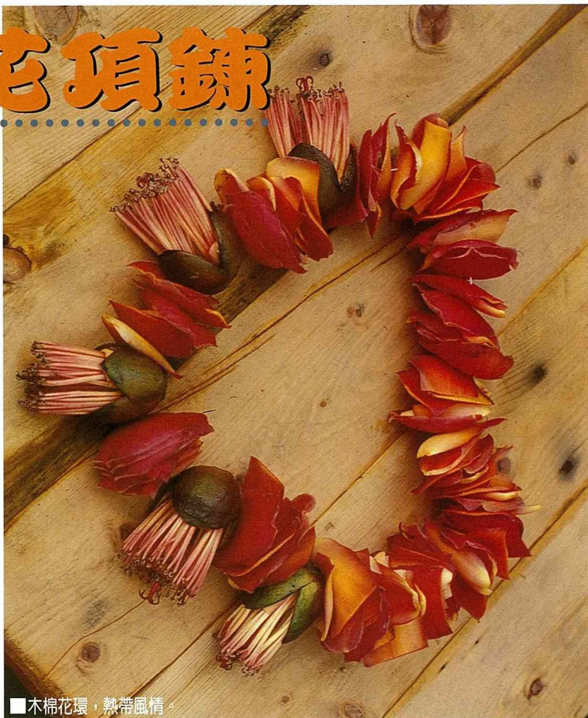
■木棉花環，熱帶風情。

散落一地的木棉花，有些幾乎完好的一如仍在枝頭綻放的風采。所以，每到木棉花季，女兒和我總是會忍不住一一撿拾落花。完美無瑕的就直接養在乘水的淺盤中當作浮花欣賞，或是直接乾乾的放在桌上，