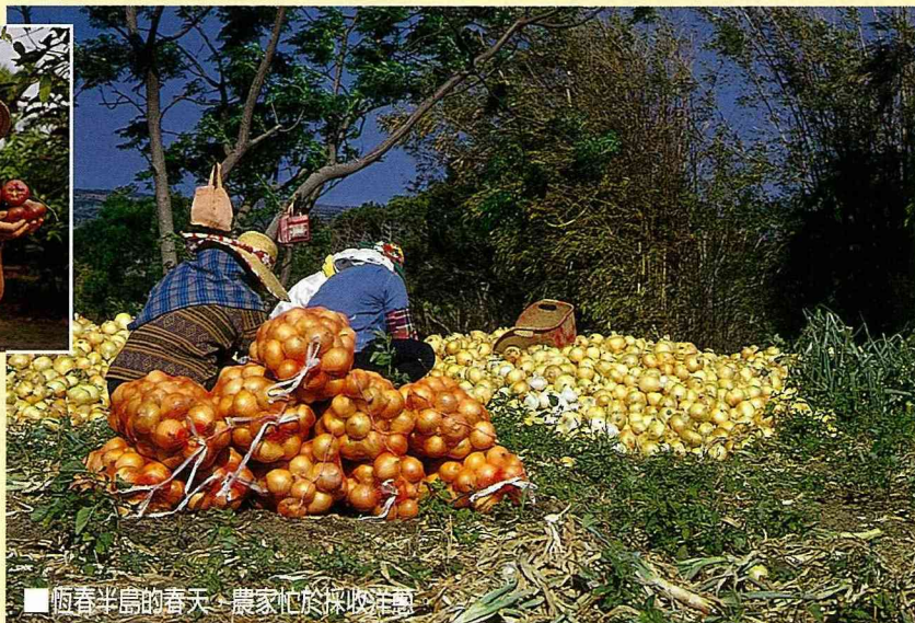
■ 恆春半島的春天，農家忙於採收洋蔥。