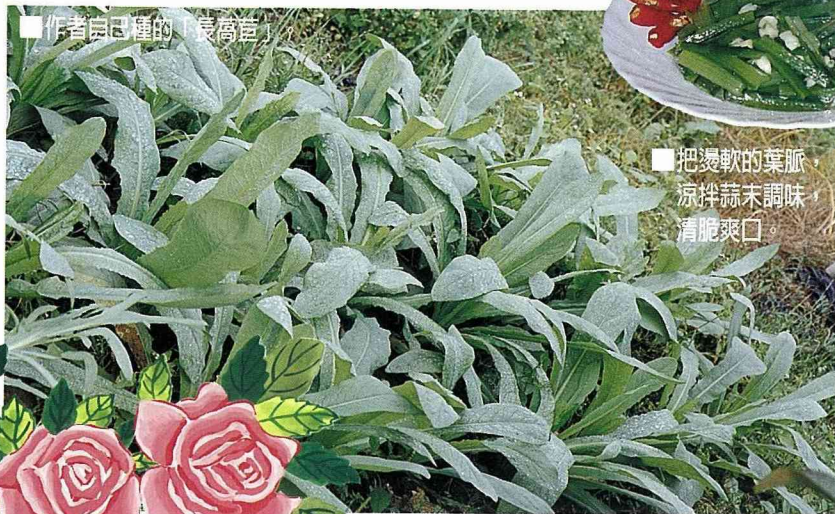
■作者自己種的「長萬莖」

最後我想告訴大家，我現在很喜歡吃萬莖，除了回憶兒時的滋味外，另一個重要原因是它讓我輕輕鬆鬆就能享受田園之樂。好栽植少蟲害是它的特色，尤其適合像我這樣不很專業又有點懶的人栽植，更是遠離農藥的健康蔬菜。所以每年秋收後，我總不忘在田頭田尾栽植一些，之後就歡喜的等待收穫。