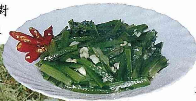
■把燙軟的葉脈涼拌蒜末調味，清脆爽口。

說了半天，相信很多人對它仍「霧煞煞」，但只要我一說到大名鼎鼎的「A菜」，大家對它定不陌生