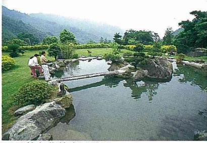
■八卦力農莊庭園美景。