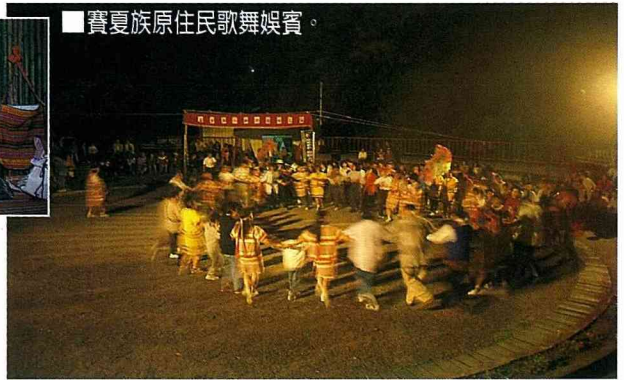
■賽夏族原住民歌舞娛賓。

南庄之美，「入目」是純樸素淨的山川田野，「進耳」是如歌的聲音言語，「迎面」是鄉野山民的熱情招呼。南庄，有著其他風景區所沒有的文化氣質，很值得您前往作客！