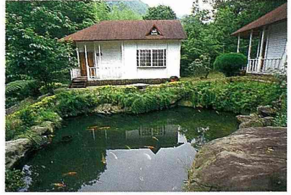
■蓬萊村一帶休閒農莊。

山地民宿村、渡假村、農場等休閒渡假的設施，如雨後春筍般出現，形成一條休閒、賞景、渡假的風景線。