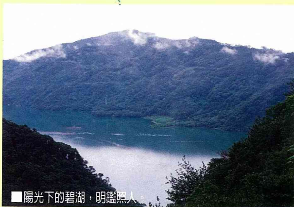
■陽光下的碧湖，明鑑照人。

「人止關」雙峰陡峭，中隔萬丈深淵，僅有一道狹窄柏油路，風景秀麗，形勢險要，有「一夫當關，萬夫莫敵」之勢，所以叫做「人止關」。民國 19 年發生的霧社事件，泰雅族原住民即扼守此處，擊斃不少日人，後遭轟炸，方告棄守。光復後，地方政府搜集原住民烈士遺骸，葬於霧社，立碑褒揚，永垂青史。凡到霧社旅遊人士，莫不前往墓地，憑弔忠魂。