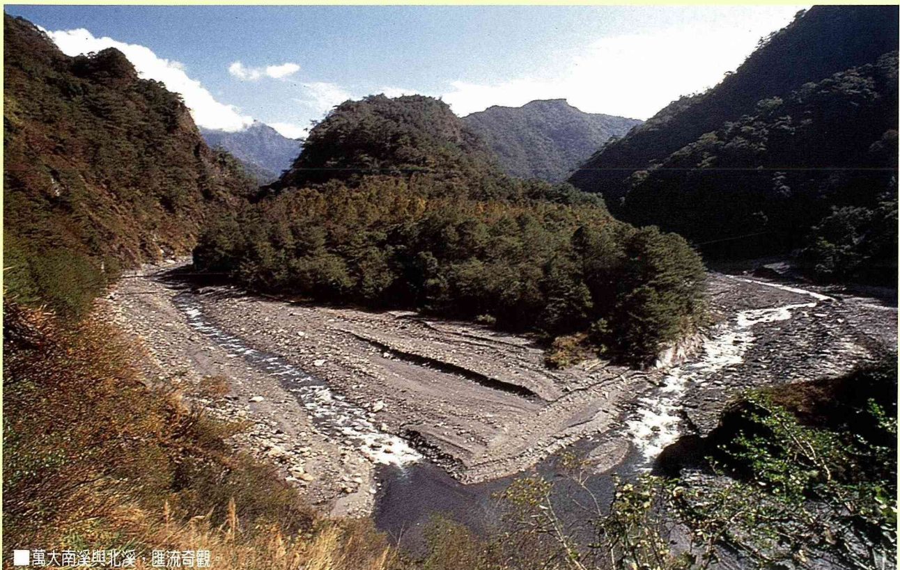
■ 萬大南溪與北溪，匯流奇觀