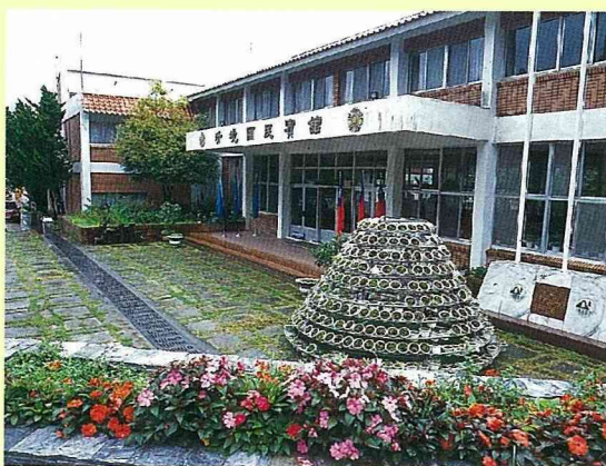
■清境農場國民賓館。

迎著晨曦，邁開步伐，就可以開始清境農場的草原之旅，綠茵遍野，遠山含笑，以及成群放牧的牛羊，這兒的人間仙境，全都屬於你。遍地綻放的波斯菊，在微風中向你招手問安——歡迎光臨，清境農場！