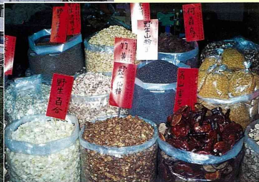
■商店出售山產，種類很多。