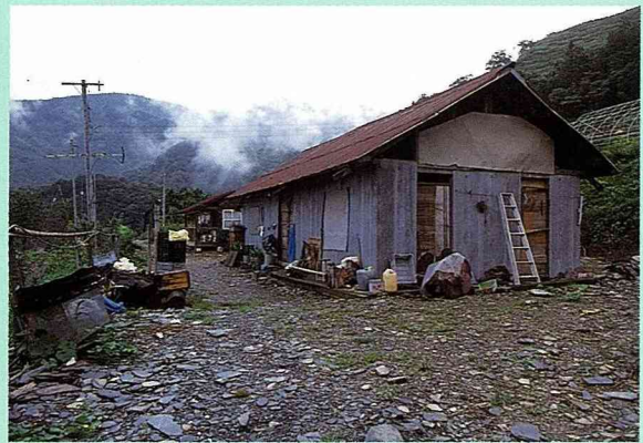
■霧社事件英雄 莫那魯道的故 居。