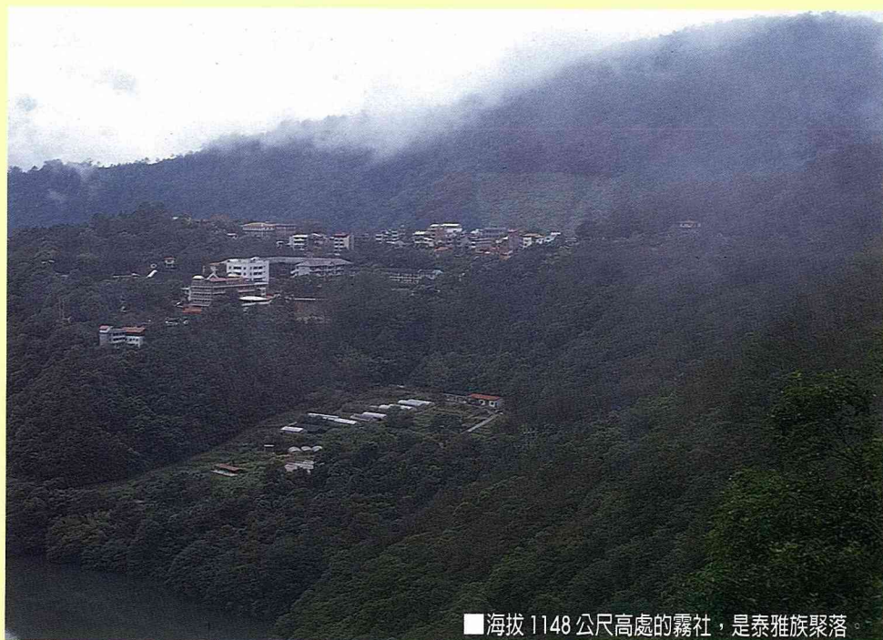
■海拔 1148 公尺高處的霧社，是泰雅族聚落

碧湖又稱「菁潭」、「臥龍潭」，湖面廣闊，從霧社農校下方起，一直延伸到萬大壩，在往合歡山、清境農場、廬山溫泉的沿途，就可以看到。湛藍的湖水，映著黛色的青山，湖光山色，令人心曠神怡。尤其從介壽亭憑欄遠眺，但見萬頃碧波，恰適地鑲在青山萬壑之間，偶而霧起雲擁，碧湖若隱若現，最是美境。