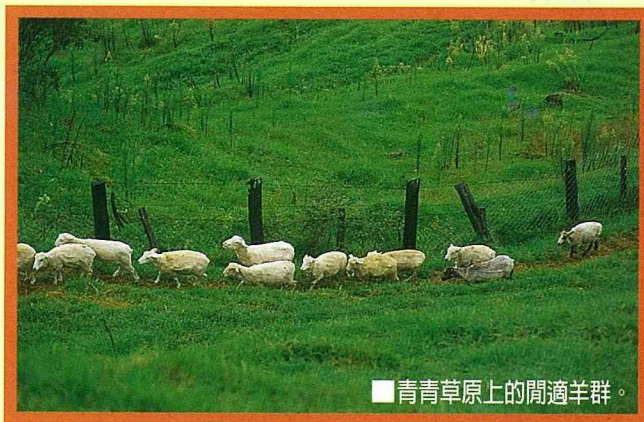
■青青草原上的閒適羊群。

清 境農場，原名「見晴農場」，成立於民國50年，是國軍退除役官兵輔導委員會所轄三個山地農場之一。農場位於南投縣仁愛鄉境內，風景優美，氣勢雄偉，空氣新鮮，且氣候宜人，向有「霧上桃源」之稱。場部設於中橫公路霧社支線之幼獅山莊，與埔里、日月潭、霧社、廬山溫泉、翠峰、合歡山，成爲一系列之休閒旅遊勝地。