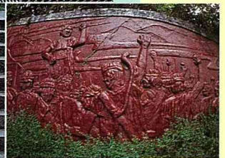
■霧社原住民抗 日彫塑圖像。