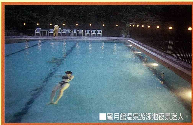
■ 蜜月館溫泉游泳池夜景迷人。

廬山溫泉發現得很早。相傳原住民獵鹿時，發現一隻受傷的鹿，跑到溫泉裏浸泡後竟然奇蹟似地痊癒了。經口耳相傳，原住民相偕前往，視此為靈泉，凡遇病痛則前來乞求靈水醫治。