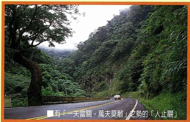
■有「一夫當關，萬夫莫敵」之勢的「人止關」

霧 社距本省地理中心點——埔里，約 24 公里，位於中部橫貫公路霧社支線（補給線），可通達合歡山、大禹嶺、梨山或太魯閣。海拔 1148 公尺，由埔里到霧社，車輛蜿蜒而上，當經過「人止關」後，坡度漸大，海拔漸高，溫度漸低，四面皆山，青翠欲滴，峰迴路轉，氣象萬千。沿途櫻樹夾道，鳥語花香，漸入佳境。