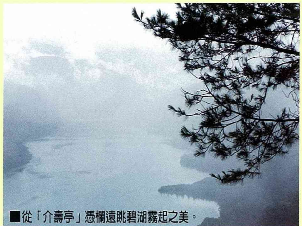
■從「介壽亭」憑欄遠眺碧湖霧起之美。

霧社在早年就被列為台灣八景之一，群山環抱，古木參天；山下溪澗，清澈見底，居民以泰雅族原住民為主，是個山翠水碧的世外桃源！