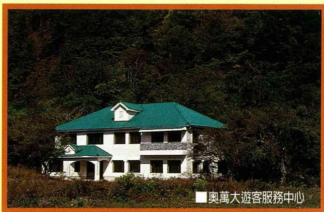
■ 奧萬大遊客服務中心

野 生動植物資源相當豐富的奧萬大森林遊樂區，在關閉多年後又重新開放，林務局南投林區管理處推荐「生態旅遊」是奧萬大森林遊樂區的特色，並呼籲遊客不要干擾區內的動植物。