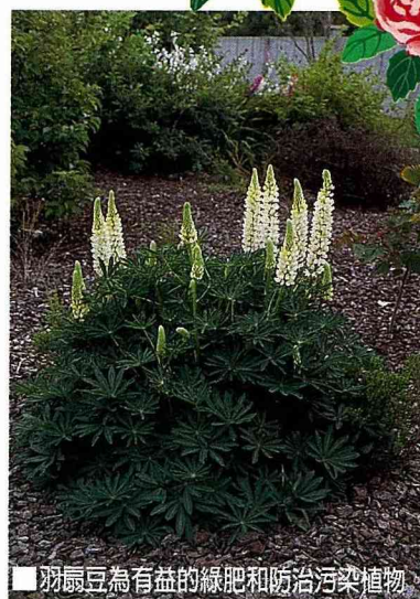
羽扇豆為有益的綠肥和防治污染植物