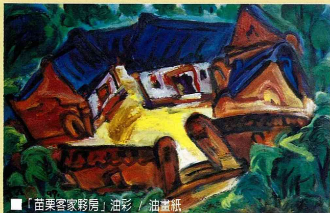
■「苗栗客家夥房」油彩 / 油畫紙