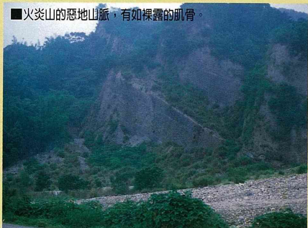
■火炎山的惡地山脈，有如裸露的肌膚。