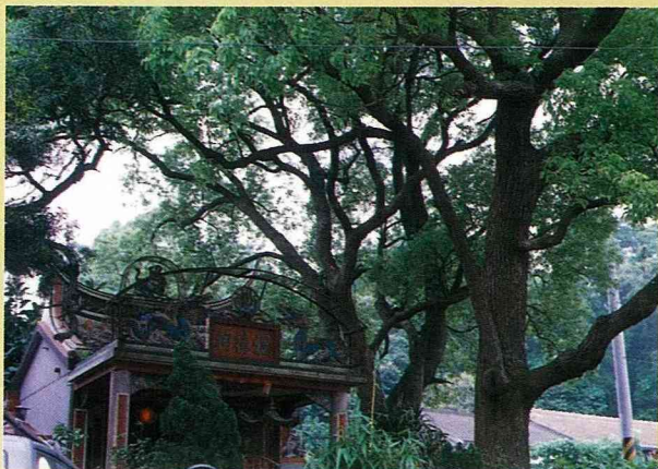
■火炎山上的樟樹與土地公廟。

油桐、相思、牛樟、檉木等雜木，它們既不像松樹、檜木、梢楠的高大挺拔，林相也一點不起眼，只是當你仔細觀察它們生長的姿態，你就會慢慢生出恭敬的心來。這些雜木必須努力伸展枝葉，以迎接有限的雨露，必須奮力穿透碎石崩土，往外往下扎根，大雨來了，把土層沖刷下去，貧脊赤紅的土壤夾雜著裸露的根鬚，紅白相間，頗為突然，被沖刷而裸露出來的根盤雜交