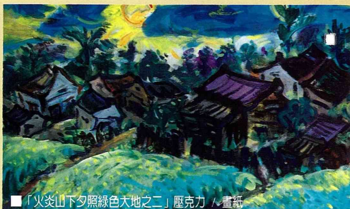
■「火炎山下夕照綠色大地之二」壓克力 / 畫紙

然、了解台灣山林的心情，表現心中台灣的風景。台灣前輩畫家用印象派的手法來表現台灣的山川人物自有他們當時的心態與背景：一來不能用明顯抗議或公開諷刺的方式來表達內心的苦悶，二來即使要表達內心的不滿，也只能假借愛情或美景拐彎抹角的來表達台灣人屈居「童養媳」似的宿命悲情與無奈而已。因此，前