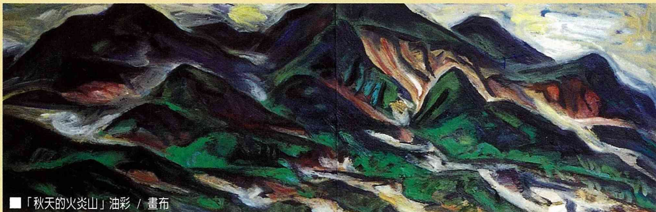
■「秋天的火炎山」油彩 / 畫布

地、族群屋舍、升斗市民、流浪漢、土地公廟；噢！還有火炎山。他的「台灣人文圖象」即是以立足本土、了解本土、疼惜本土的情懷，把這種「土地認同」、「本土文化」的覺醒以磅薄敘事詩般的濃烈關懷表現出來。畫中旺盛的生命力和率直強勁奔放的畫風，無拘無束的筆觸和濃郁的質感，使畫面充滿了戲劇性張力和原創性。