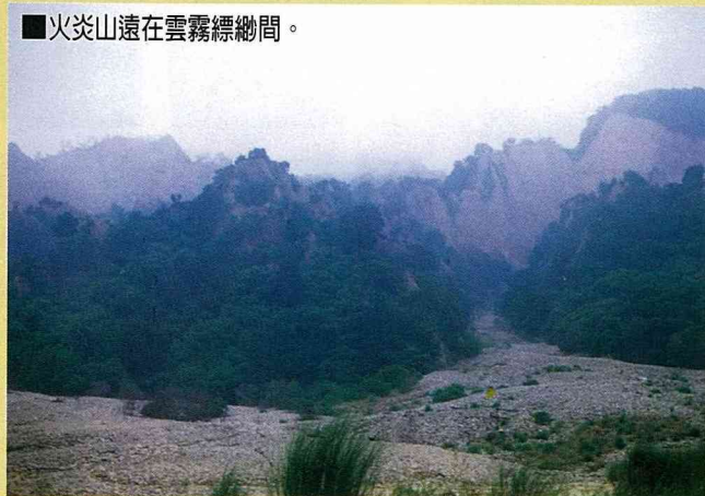
■火炎山遠在雲霧縹緲間。