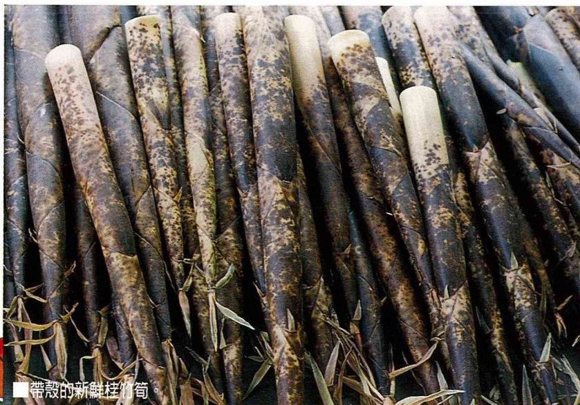
■帶殼的新鮮桂竹筍。

桂 竹筍長度達50公分以上，是鮮筍類中最長的。筍殼為斑塊狀深褐色，略有絨毛。原產我國江南，約280年前引入本省。產期短，只3~4月份採嫩筍，其餘月份不產筍，但可買到煮熟後的熟筍。產地集中台北縣三峡，苗栗縣大湖，花蓮縣秀林，南投縣竹山、中寮、魚池、水里等地，以大湖農會供應量佔六成以上為最多。嫩筍長出土面高約40~60公分時採收，沿地面摘斷，去殼，當天上午煮