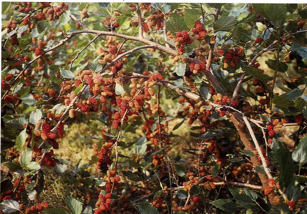
■桑椹的果實，你見過嗎？

次之。桑椹通常在4月上旬清明節前後成熟，生果呈紫黑色時採收。生果如為銷售到市場要用人工採摘，加工用可用手搖下再收集。營養成分有水分89.8，蛋白質0.5，脂肪0.3，糖類10.2，維他命A、C，鈉、鐵。桑椹以鮮食為主，亦可加工製成水果酒、蜜餞、果醬、果汁及糖漬等。選購時以果實大，呈紫黑色，長圓形者為佳。炎炎夏天在全省各地觀光旅遊區，可見到冰涼攤桑果汁，在日本是高級冷飲之一。冰涼後的桑果汁，那股微酸帶甜的口感真夠勁。