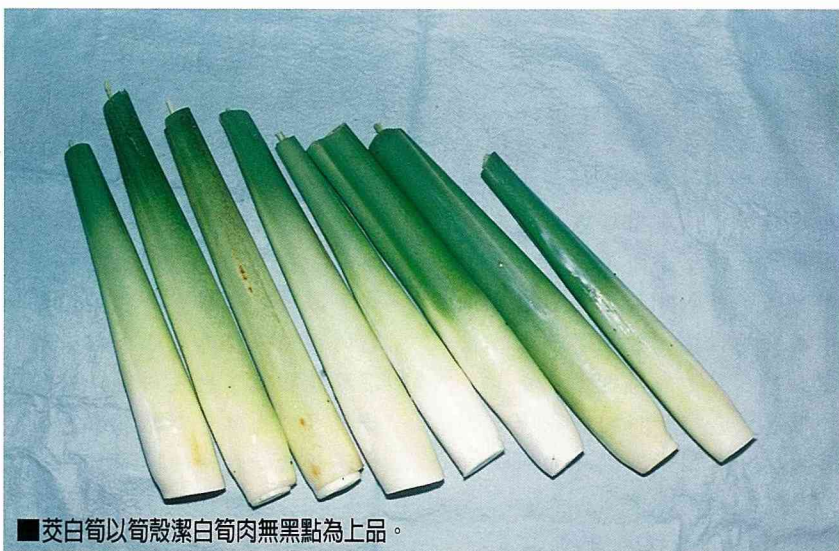
■茭白筍以筍殼潔白筍肉無黑點為上品。

在嫩莖肥大細嫩，未凸起蓬鬆粗糙，葉鞘微裂見筍時，筍農每天清晨用鐮刀自筍下方基部割取，切掉葉片及葉鞘，留外殼長32公分，殼片4~5片，以PE袋