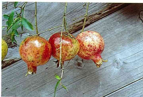
■果石榴類的四季石榴一年可結兩次果實。

果石榴類:有紅石榴、白石榴、酸石榴以及四季石榴等。所謂四季石榴,在本省以及熱帶地區一年可結兩次果實,大多在3至4月開花,果實在8至9月成熟;9至10月開花,果實則於第二年的3至4月成熟。