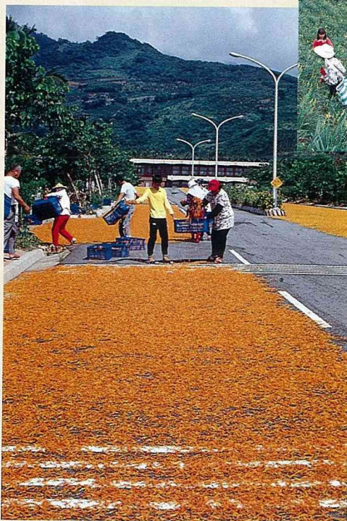
■ 晒金針為大地賦色。

目前，本省經濟栽培俗稱「金針菜」的金針，是1661年由先民從華南引入，在本世紀初年，日人田代安定氏從日本引進橙萱，民國54年，台灣大學園藝系杜賽性教授自日本引進了重瓣萱草、麝香萱、雜交萱草。民國61年，台灣大學園藝系蔡平里教授從日本引進了紅萱、鬱金萱、白雲萱、本萱、小葉萱、野萱等。