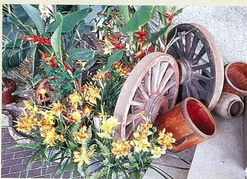
■ 金針花可作為切花應用。

台 東縣太麻里鄉的金針山，每屆金針菜採收期，即呈現一片忙碌的景象，山上採金針、工廠金針加工，以及屋頂上、公路旁、庭院前曬金針，滿眼豔麗金黃，宛如走入金黃世界！