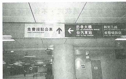
■「免費接駁公車」指標。