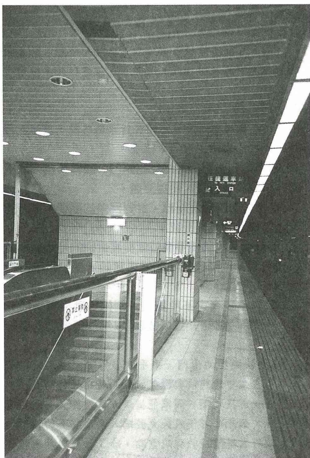
■鐵路車站往捷運入口，方便轉乘火車的乘客。