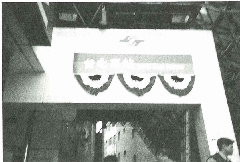
■台北車站下，往捷運車站。