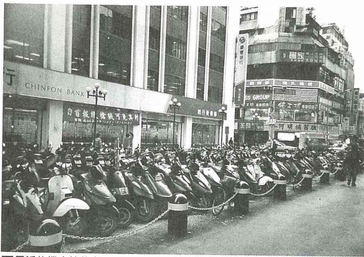
■最近的機車停放處。