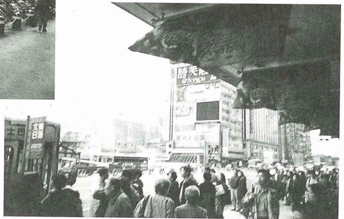
■出口後，即是搭公車處。