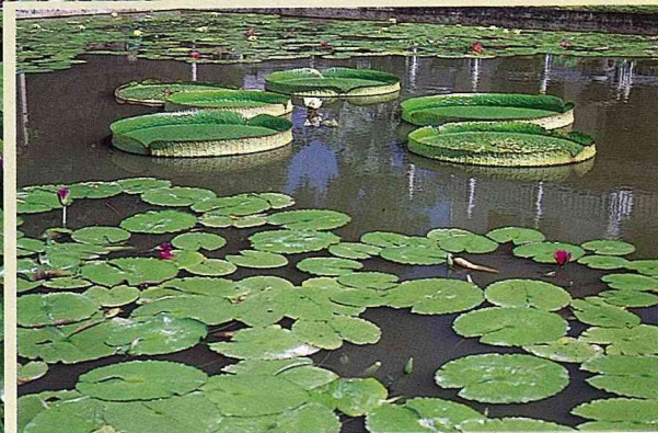
■ 世界最大型的大王蓮。

台灣蓮花研究中心在去年間與大陸學術單位合作進行中國荷花品種研究工作，由該學術單位陸續引進中國荷花品種栽培，至今已成功繁殖出一百多個品種的中國荷花，一枝獨秀盛放於陂塘中。同時在交通部觀光局撥款補助下，成立了「蓮花世界」資訊館，開放供人參觀。